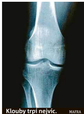
Klouby trpí nejvíc. MAFRA

To její zasahuje děti a mladistvé do 16. roku života. Způsobuje bolestivé záněty kloubů, které mnohdy nenávratně ničí. „Byla jsem v sedmé třídě, kvůli bolestem jsem dostala omluvenku na tělocvik. Tehdy jsem to nesla těžce,