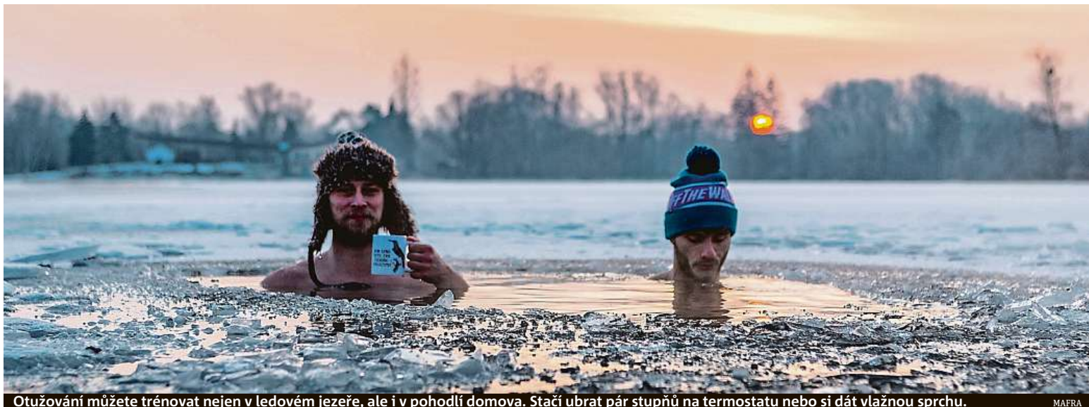
Otužování můžete trénovat nejen v ledovém jezeře, ale i v pohodlí domova. Stačí ubrat pár stupňů na termostatu nebo si dát vlažnou sprchu.