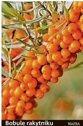
Bobule rakytníku MAFRA

Pokud máte rádi ovoce, zkuste vynechat to dovážené zdaleka a pusťte se do obyčejného českého jablka. Přece jen tropické ovoce muselo být řádně ošetřeno a nadopováno, aby vydrželo až k vám na talíř. Nejlepší je jablko z vlastní zahrady nebo, když už kupované, tak nejlépe z lo-