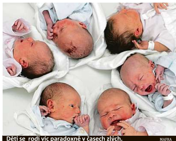
Děti se rodí víc paradoxně v časech zlých.

Na druhou stranu se ale lidé často spoléhají až přehnaně na lékařskou vědu i státní podporu. Když se přirozené početí ve věku nad třicet nebo třicet pět let nedaří, svěřují se do péče reprodukční kliniky. Mohou využít i skutečnosti, že pacientkám do