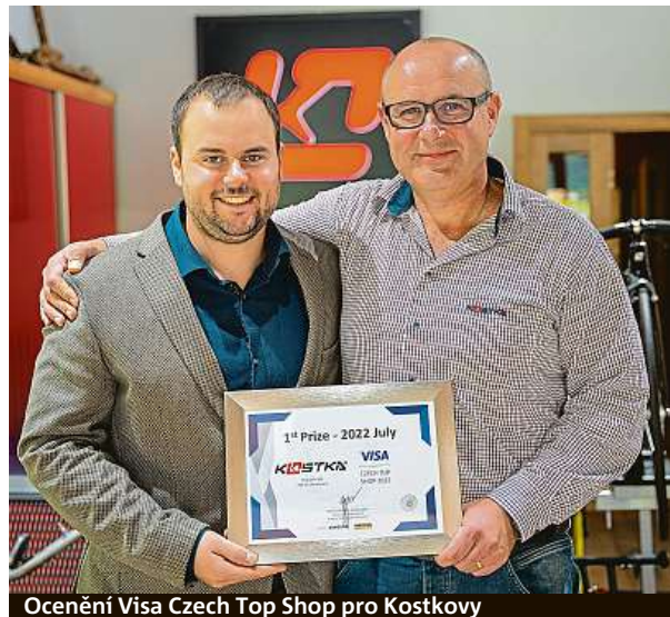
Ocenění Visa Czech Top Shop pro Kostkovy

Koloběžky jsou trendem, který stále častěji vidáme v ulicích měst, ale také na trackových cestách v přírodě.