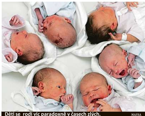
Děti se rodí víc paradoxně v časech zlých.

Na druhou stranu se ale lidé často spoléhají až přehnaně na lékařskou vědu i státní podporu. Když se přirozené početí ve věku nad třicet nebo třicet pět let nedaří, svěřují se do péče reprodukční kliniky. Mohou využít i skutečnosti, že pacientkám do