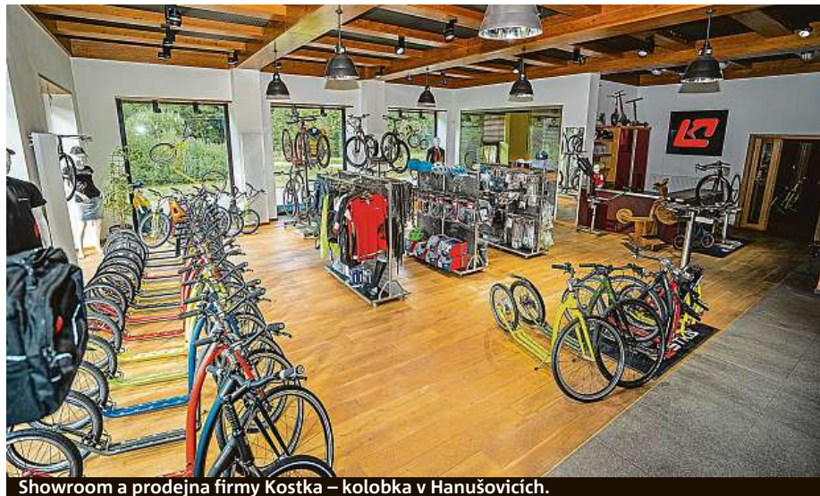
Showroom a prodejna firmy Kostka – kolobka v Hanušovicích.