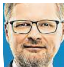
Petr Fiala, ODS

1) Dusí nás rostoucí byrokracie, proto přicházíme s „antibyrokratickou revolucí“. Zrušíme zbytečné agendy a zefektivníme administrativu. Zjednodušíme daňový systém a snížíme daně, což povede k růstu mezd všech zaměstnanců o sedm procent. Posílíme investice do dopravy, vzdělání, výzkumu a obrany. Je potřeba, aby lidé z ekonomického růstu něco měli a abychom investovali do věcí, které zajistí naši dobrou budoucnost.