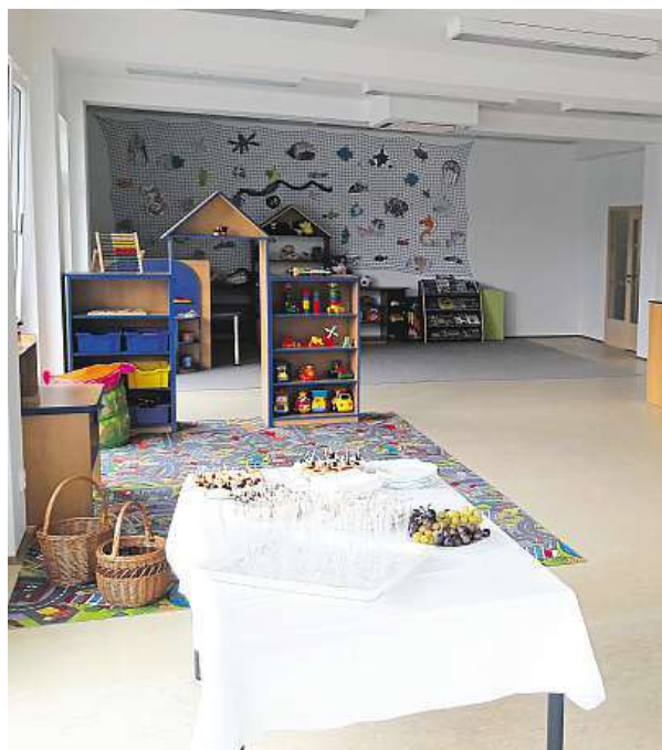
Takhle vypadá nová herna.