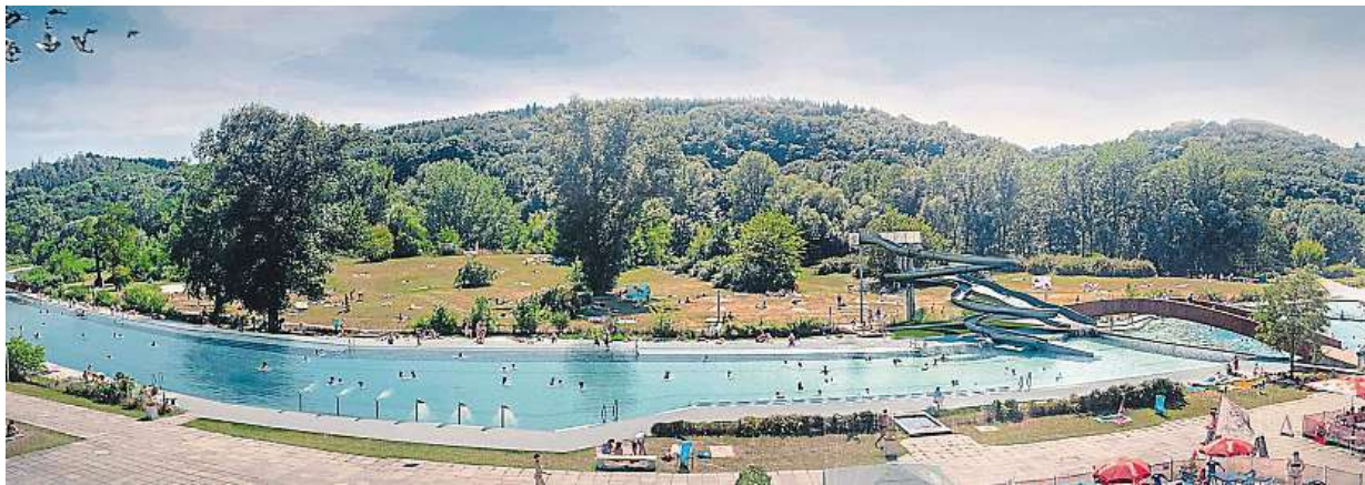
V rámci rekonstrukce se opraví i místa, kterými protéká voda. Novinkou budou také atrakce.