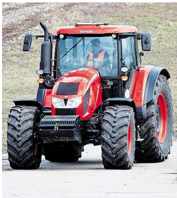
Zetor na projíždce

V současnosti jsou do oblasti expedovány první traktory. Filipíny jsou pritom v pořadí již šestým státem, kam se značka Zetor podařilo vstoupit od ledna letošního roku, s dalšími státy firma postupně vede jednání. ČTK