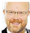
Vlastimil Válek, TOP 09

1) Stát, místo aby sloužil občanům, občanů šikanuje. Bující legislativa považuje každého občana za podezřelého z toho, že kradne, neplatí daně, podvádí. Je tu cítit odklon od křesťanských hodnot, přestává být důležitá rodina a roste modla: kariéra.