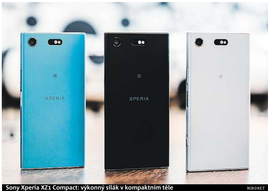
Sony Xperia XZ1 Compact: výkonný silák v kompaktním těle

Sony Xperia XZ1 Compact pořídíte například v internetovém obchodě Mironet, kde navíc k nákupu získáte powerbanku v hodnotě 399 korun jako dárek.