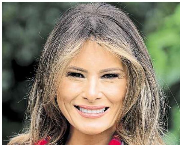
Melania Trumpová, třetí manželka Donalda Trumpa

První manželka amerického prezidenta Trumpa vydala knihu. Zřejmě i proto se na sebe snaží upoutat pozornost.