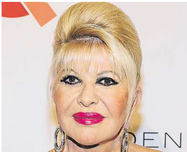
Ivana Trumpová, první manželka Donalda Trumpa