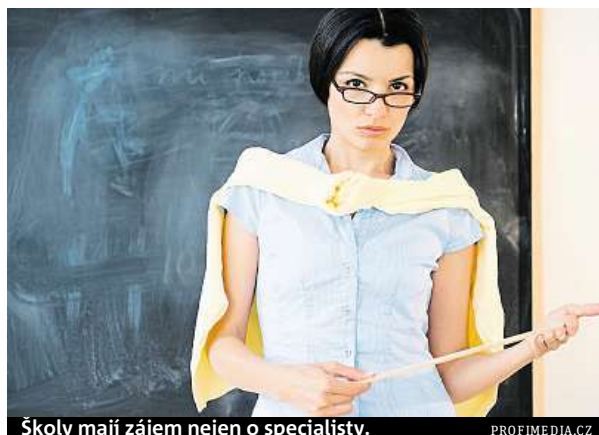
Školy mají zájem nejen o specialisty.

„Proč dochází k nárůstu nezaměstnanosti v prázdninových měsících, o tom ministerstvo školství nemá žádné konkrétní informace, ani nevede žádné statistiky. Kontak-