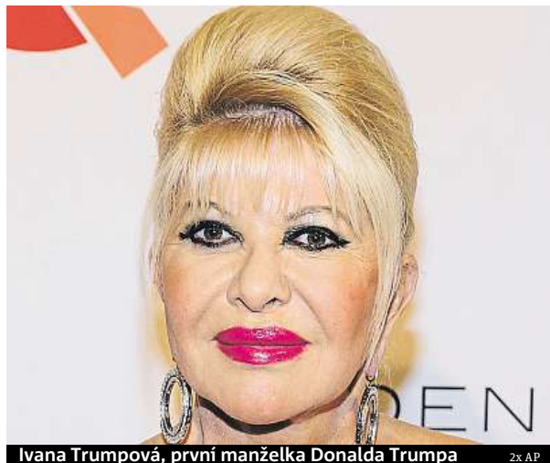
Ivana Trumpová, první manželka Donalda Trumpa 2x AP