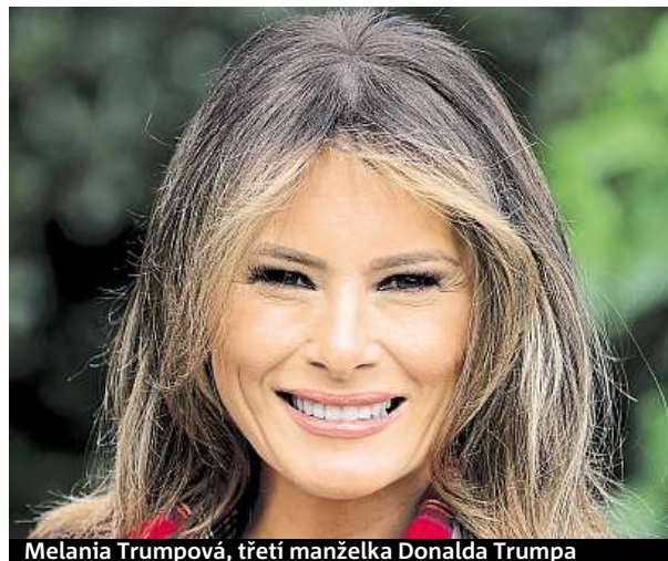
Melania Trumpová, třetí manželka Donalda Trumpa

První manželka amerického prezidenta Trumpa vydala knihu. Zřejmě i proto se na sebe snaží upoutat pozornost.