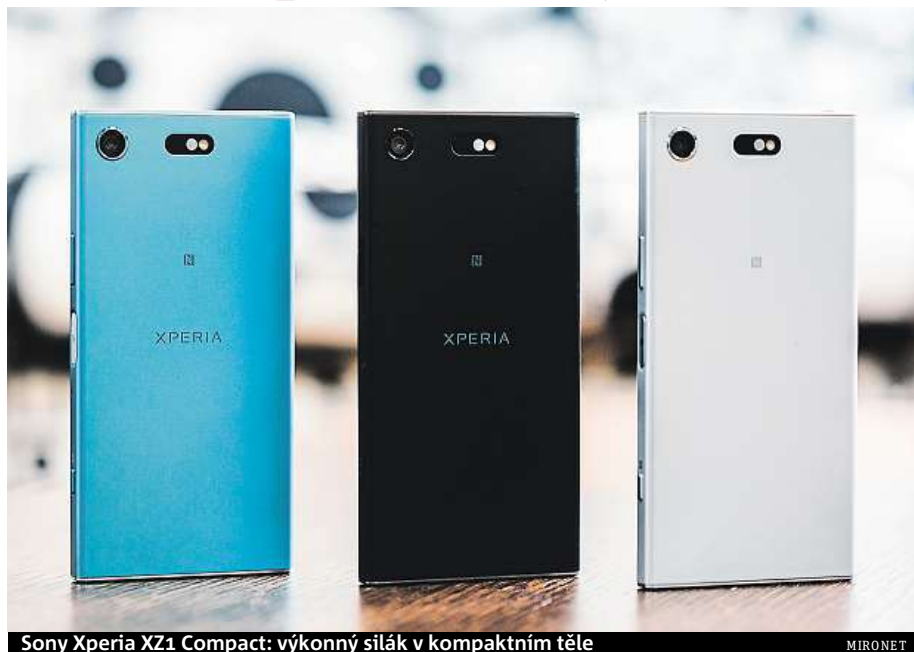
Sony Xperia XZ1 Compact: výkonný silák v kompaktním těle

Sony Xperia XZ1 Compact pořídíte například v internetovém obchodě Mironet, kde navíc k nákupu získáte powerbanku v hodnotě 399 korun jako dárek.