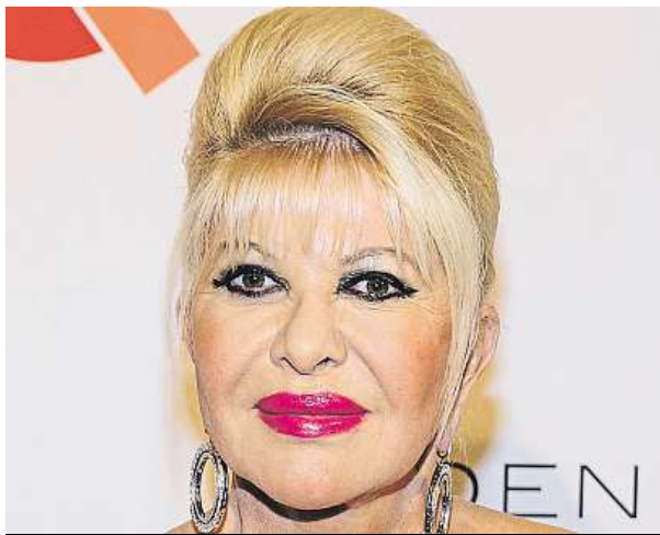
Ivana Trumpová, první manželka Donalda Trumpa