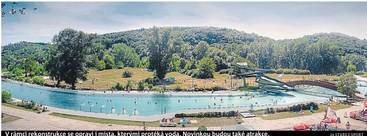
V rámci rekonstrukce se opraví i místa, kterými protéká voda. Novinkou budou také atrakce.