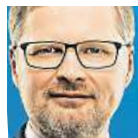
Petr Fiala, ODS

1) Dusí nás rostoucí byrokracie, proto přicházíme s „antibyrokratickou revolucí“. Zrušíme zbytečné agendy a zefektivníme administrativu. Zjednodušíme daňový systém a snížíme daně, což povede k růstu mezd všech zaměstnanců o sedm procent. Posílíme investice do dopravy, vzdělání, výzkumu a obrany. Je potřeba, aby lidé z ekonomického růstu něco měli a abychom investovali do věcí, které zajistí naši dobrou budoucnost.