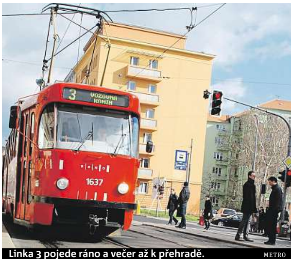
Linka 3 pojedí ráno a večer až k přehradě.

Tramvaje číslo 3 by v ranních a večerních hodinách neměly končit ve Vozovně Ko-