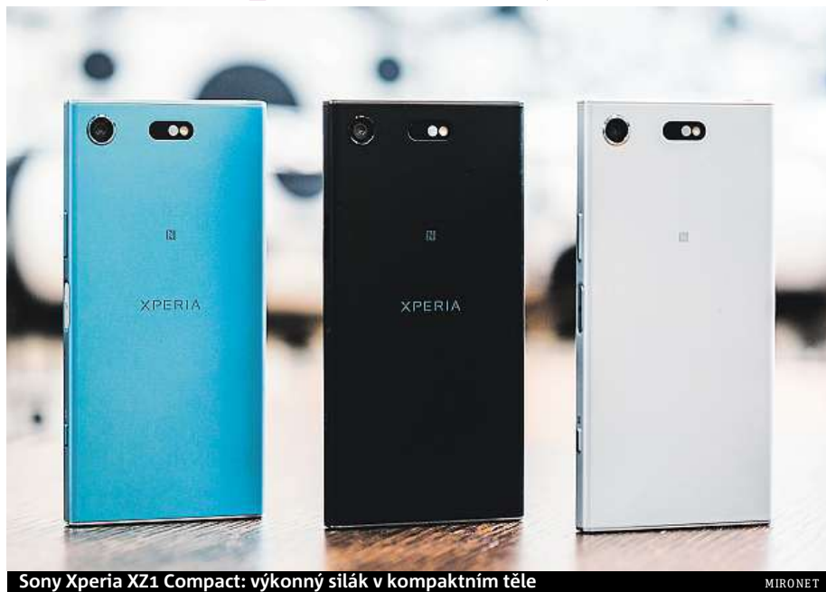
Sony Xperia XZ1 Compact: výkonný silák v kompaktním těle

Sony Xperia XZ1 Compact pořídíte například v internetovém obchodě Mironet, kde navíc k nákupu získáte powerbanku v hodnotě 399 korun jako dárek.