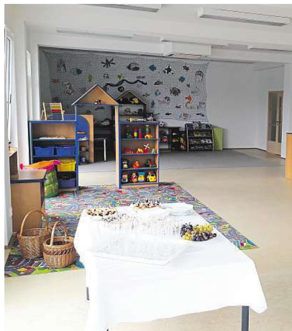
Takhle vypadá nová herna.