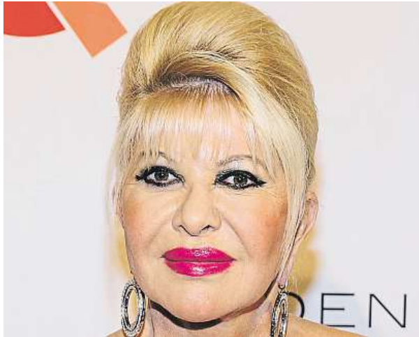
Ivana Trumpová, první manželka Donalda Trumpa