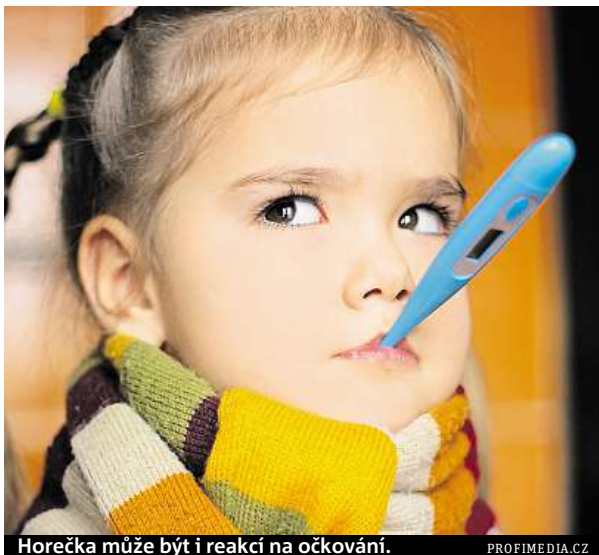
Horečka může být i reakcí na očkování.

Při běžném projevu doprovázejícím chřipku, nachlazení nebo anginu není potřeba nijak zasahovat, pokud teplota nepřekročí 38 °C. „Nejčastější příčinou horečky je virová, bakteriální či parazitická infekce. Mohou ji však zapříčinit i neinfekční onemocnění provázená zánětem. Termoregulační systém, který se nachází v mozku, teplotu zvýší, jakmile dojde v těle k závažným reakcím na vnější či