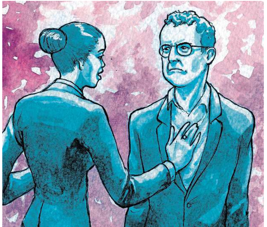
The Merchant of Venice

5. If Mr Shylock decides not to be merciful, the ..... will punish the merchant.