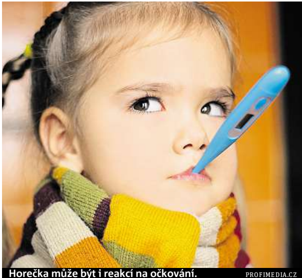
Horečka může být i reakcí na očkování.

Při běžném projevu doprovázejícím chřipku, nachlazení nebo anginu není potřeba nijak zasahovat, pokud teplota nepřekročí 38 °C. „Nejčastější příčinou horečky je virová, bakteriální či parazitická infekce. Mohou ji však zapříčinit i neinfekční onemocnění provázená zánětem. Termoregulační systém, který se nachází v mozku, teplotu zvýší, jakmile dojde v těle k závažným reakcím na vnější či