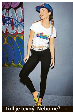
Lidl je levný. Nebo ne? LIDL

Řetězec proto nyní přichází s ještě rozšířenější nabídkou. V ní se kromě zmínovaných produktů nachází navíc dámské legíny, kšiltovky či sportovní doplňky. Firma produkty naskladňuje postupně, teď jsou proto na webu Lidlu k dispozici převážně trička, doplňky a některé pantofle, později přijdou na řadu tepláky. Firma ale svůj slib deníku Metro nesplnila. Ani na letáčích, ba ani v newsletteru, který rozesílá zákazníkům