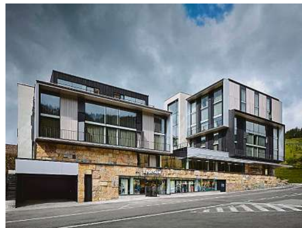
Novinka v Peci pod Sněžkou

„Chtěli bychom vytvořit dokonalý servis pro ty, kteří rádi tráví volný čas v horském prostředí,“ říká ředitel