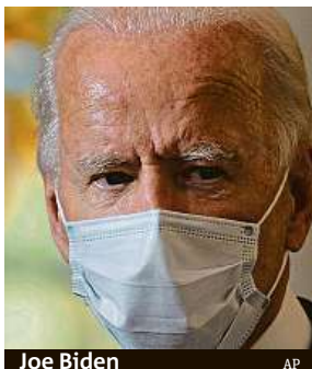
Joe Biden

„Chtěl jsem to vždycky zlehčovat. Pořád to rád zlehčuju, protože nechci vytvořit paniku,“ řekl prezident 19. března novináři Bobu