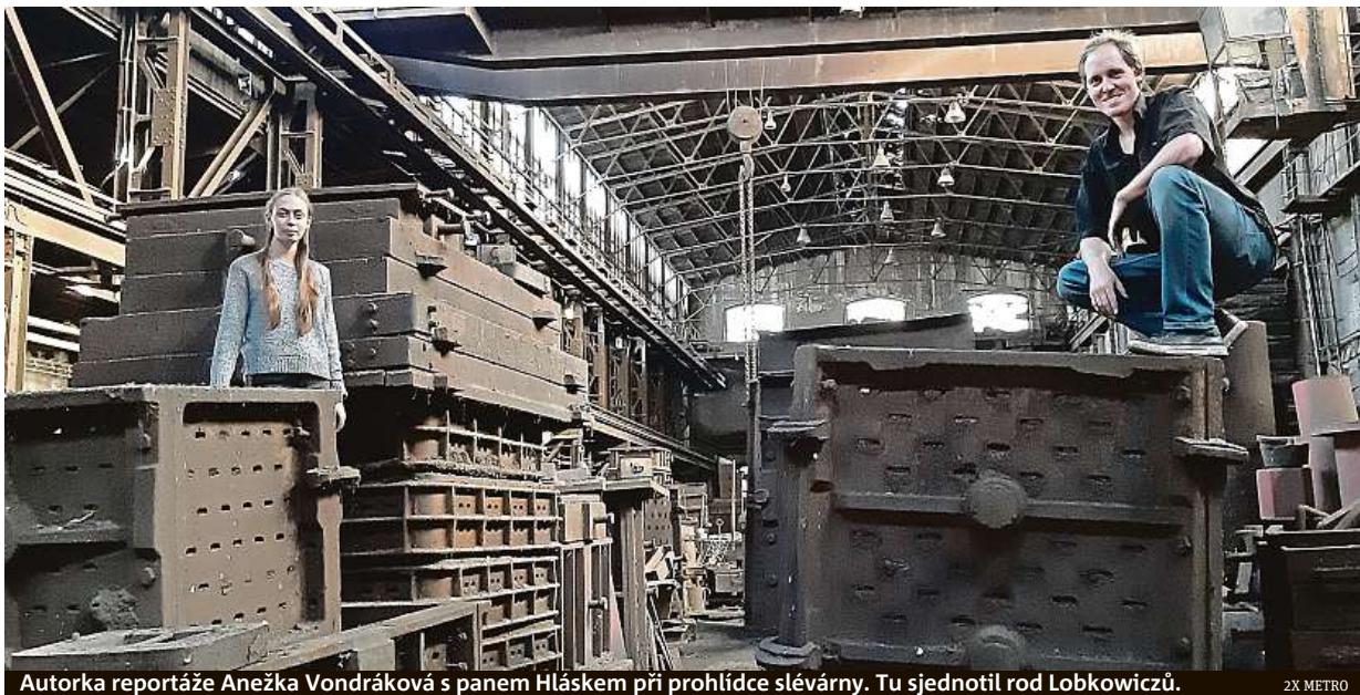
Autorka reportáže Anežka Vondráková s panem Hláskem při prohlídce slévárny. Tu sjednotil rod Lobkowiczů.

• Vdova Jitka 62. Jsem finančně zajištěná, ale bez dětí a nešťastná. Pomůže mi někdo? Mám ráda muchlování! Ozvi se mi na 909 80 50 40 nebo SMS na 909 15 45 s kódem 81ZNN a tvůj text!