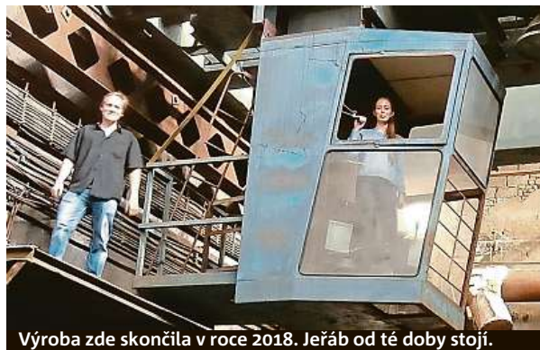
Výroba zde skončila v roce 2018. Jeřáb od té doby stojí.