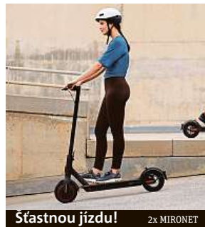
Šťastnou jízdu! 2x MIRONET

Pro maximální jistotu je připravený duální brzdový systém, který kombinuje klasickou zadní brzdou s E-ABS brzdou na předním kole, jež zaručí, že brzdění bude bezpečné, rychlé a snadné.