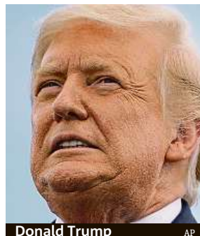
Donald Trump

Tolik dní zbývá do řádného termínu amerických prezidentských voleb, který je naplánován na úterý 3. listopadu. Soupeři jsou – 74letý republikán, současný prezident USA Donald Trump a 77letý demokrat Joe Biden.