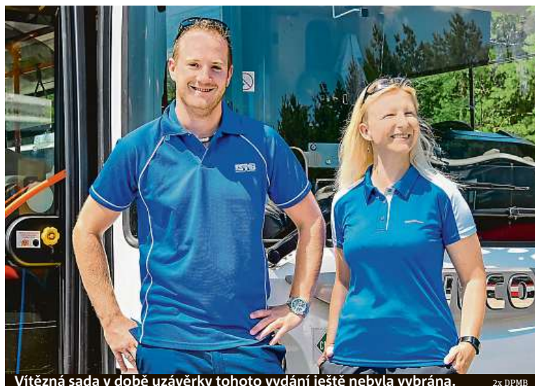
Vítězná sada v době uzávěrky tohoto vydání ještě nebyla vybrána.