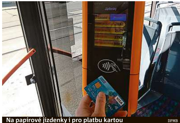
Na papírové jízdenky i pro platbu kartou

vedoucí tarifního oddělení Vít Prýgl. Nové elektronické odbavování je nastaveno tak, že cestujícímu na konci dne na základě jízdy vybere tu nejvýhodnější variantu. Pokud pojedete člověk během dne čtyřikrát, nezaplatí čtyři hodinové jízdenky po 25 korunách, ale systém mu při poslední jízdě odečte pouze patnáct korun, protože rozpozná, že cestujícímu by se v danou chvíli vyplatila celodenní jízdenka za 90 korun. Kdo bude mít zájem o zlevněnou nebo vícezónovou jízdenku, tak si svou variantu zvolí ručně na displeji a poté kartou zaplatí. Kontrola takto zakoupených jízdenek bude probíhat stejně jako doposud u elektronických předplatných jízdenek. Pracovníci přepravní kontroly disponují čtečkami, ke kterým cestující přiloží svou kartu a revizoři zkontrolují, zda mají platnou jízdenku. „Předpokládáme, že spuštění nové-