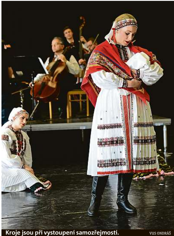
Kroje jsou při vystoupení samozřejmostí.