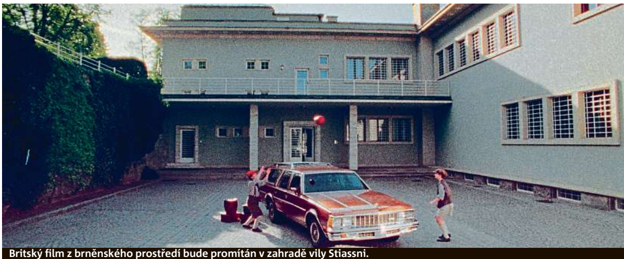
Britský film z brněnského prostředí bude promítán v zahradě vily Stiassni.