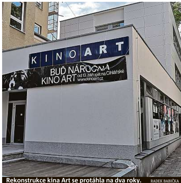
Rekonstrukce kina Art se protáhla na dva roky.