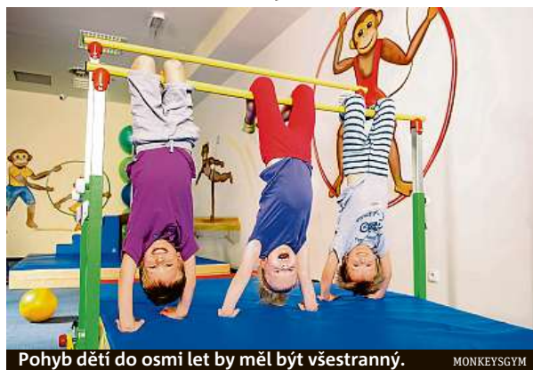
Pohyb dětí do osmi let by měl být všestranný. MONKEYSGYM

Při výběru sportovního kroužku doporučuje vzít v úvahu hlavně povahu dítěte – je extrovertní a rychle překoná ostych z nového kolektivu, můžete tedy zvolit jakýkoliv kroužek i mimo školní prostředí. Nebo je spíš introvertní a dal by přednost sportování s kamarády, které už dobře zná? Dítě, které je spíš introvertní, se patrně bude těšit mnohem víc ze školou organizovaného kroužku, než když ho přihlá-