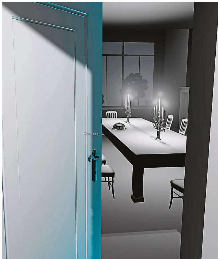
Záběr z počítačové hry

2x DARIA MARTINOVÁ, S LASKAVÝM SVOLENÍM MAUREEN PALEYOVÉ, LONDÝN