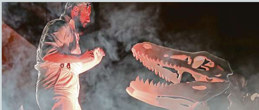
Noční představení Ztracený svět v Českém Krumlově bylo vyprodané.