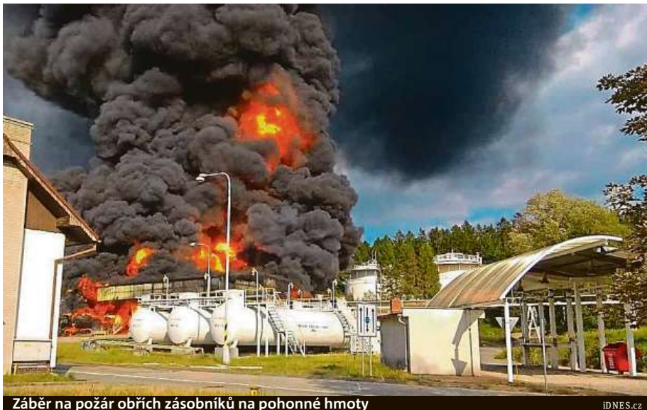
Záběr na požár obřích zásobníků na pohonné hmoty

Čepro na místě skladuje palivo pro státní rezervu. Ve čtyřech gigantických nádržích za 1,4 miliardy korun je uloženo celkem 140 tisíc kubíků pohonných hmot. Jedna kruhová nádrž má 22 metrů