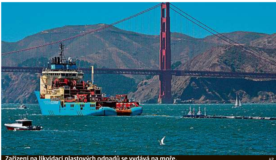
Zařízení na likvidaci plastových odpadů se vydává na moře.

Zařízení má podobu šest set metrů dlouhé plovoucí hráze, na níž je zespodu upevněná přepážka sahající až do