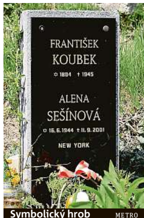
Symbolický hrob METRO