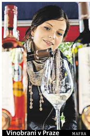
Vinobraní v Praze MAFRA

V neděli od 14 hodin se v zahradě Domova sv. Karla Boromejského v Praze-Řepích uskuteční druhý ročník Vinobraní v klášteře. Nově založe-