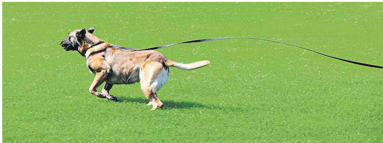
Předmětem nové vyhlášky bude především povinnost mít psa na vodítku téměř všude. Může být jakékoliv.