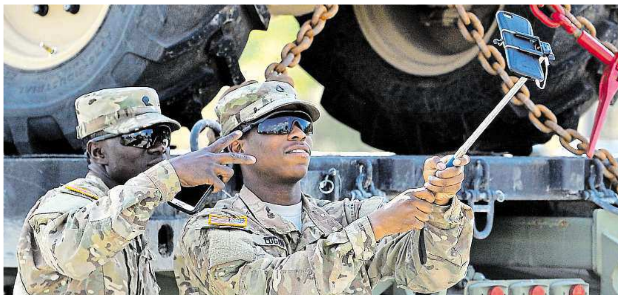
Uděláme si fotku a mažeme dál. Americký vojenský konvoj včera projel Českem. Z Bavorska zamířil do Maďarska.

Stále on-line. Pokud někdo otevře dveře vaší chaty, zapípá vám telefon. Nová síť. Takzvaný internet věcí se rozjede už v půlce roku 2016. Vydrží roky. Různá zařízení pro sledování budou nabitá až deset let STRANA 2