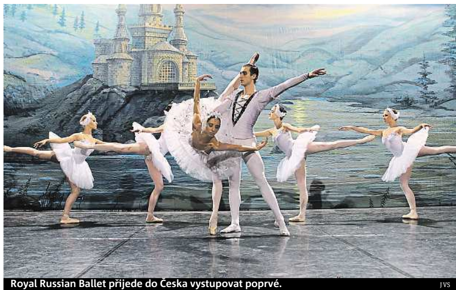
Royal Russian Ballet přijede do Česka vystupovat poprvé. JVS