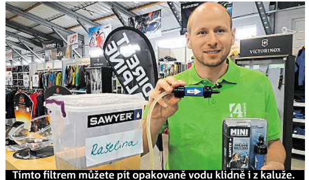
Tímto filtrem můžete pít opakovaně vodu klidně i z kaluže.