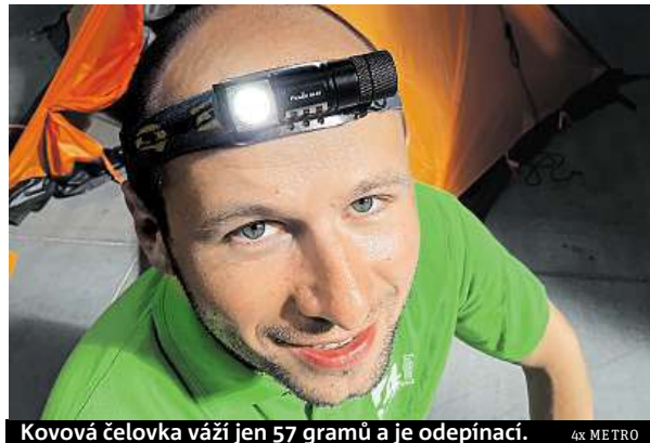
Kovová čelovka váží jen 57 gramů a je odepínací.