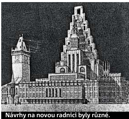
Návrhy na novou radnici byly různé.