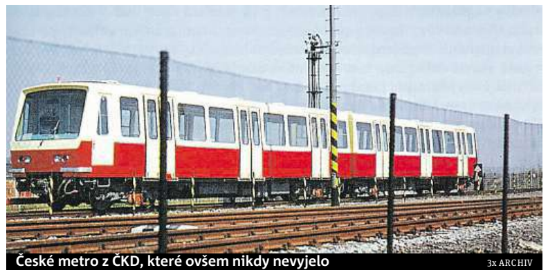
České metro z ČKD, které ovšem nikdy nevyjelo