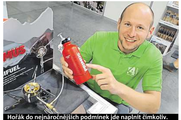
Hořák do nejnáročnějších podmínek jde naplnit čímkoliv.