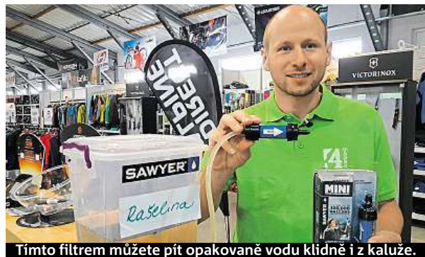
Tímto filtrem můžete pít opakovaně vodu klidně i z kaluže.