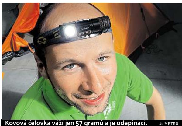
Kovová čelovka váží jen 57 gramů a je odepínací.