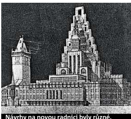
Návrhy na novou radnici byly různé.