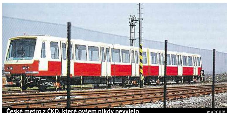
České metro z ČKD, které ovšem nikdy nevyjelo