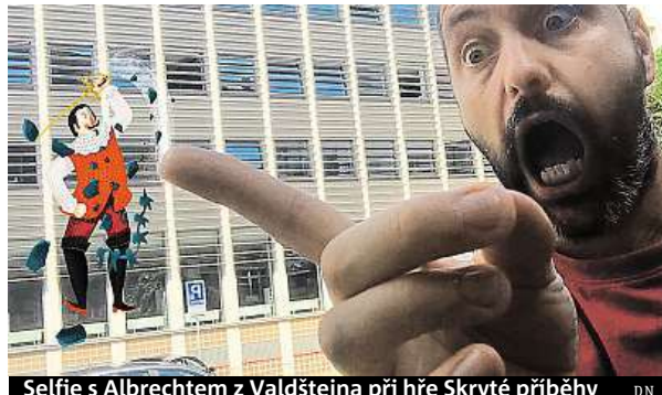
Selfie s Albrechtem z Valdštejna při hře Skryté příběhy DN

Geolokační mobilní aplikace jsou v současnosti celosvětovým trendem. „Často totiž přináší ekonomické oživení v jednotlivých regionech,