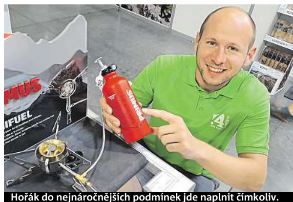
Hořák do nejnáročnějších podmínek jde naplnit čímkoliv.