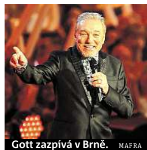
Gott zazpívá v Brně.

O týden později se můžou fanoušci v Brně těšit na jedinečné vystoupení Karla Gotta