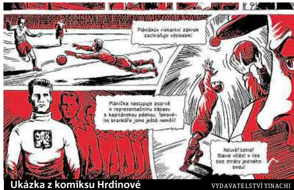
Ukázka z komiksu Hrdinové