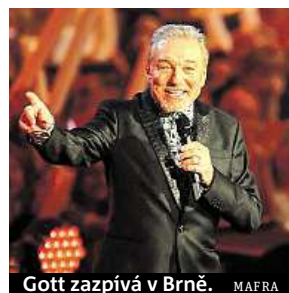
Gott zazpívá v Brně.

O týden později se můžou fanoušci v Brně těšit na jedinečné vystoupení Karla Gotta