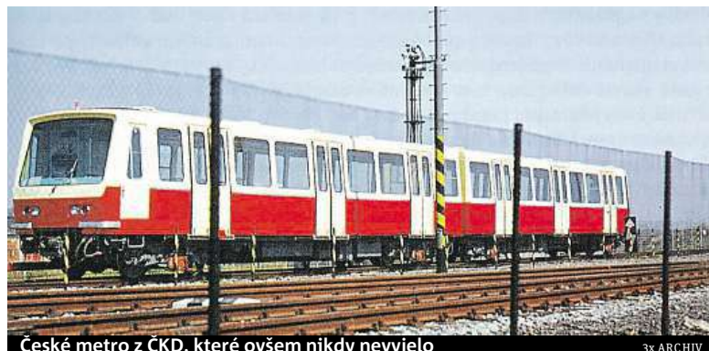
České metro z ČKD, které ovšem nikdy nevyjelo