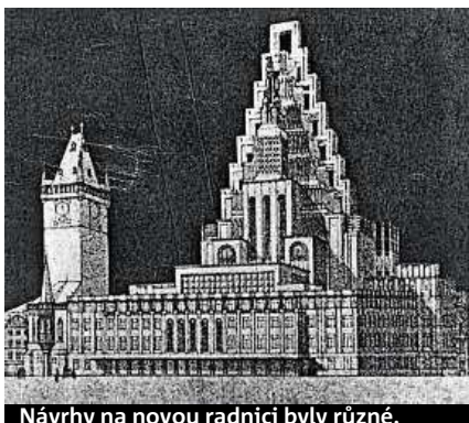
Návrhy na novou radnici byly různé.