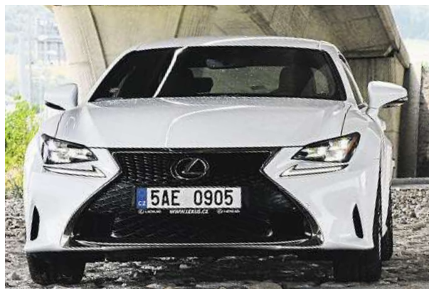
Pokud se vám vůz líbí, připravte si 1,5 milionu korun.