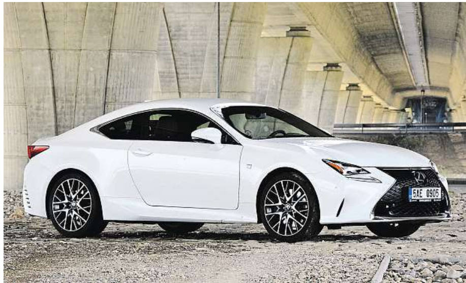
Lexus RC 200t je navenek fešák, ale uvnitř si ho budete také užívat.

Předností testovaného čtyřválcového je docela svižná odezva na přidání plynu, vysoký točivý moment dává už od nízkých otáček. Vůz přitom disponuje maximem výkonu 180 kW (245 koní) a nejvyš-