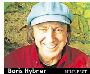
Boris Hybner MIME FEST