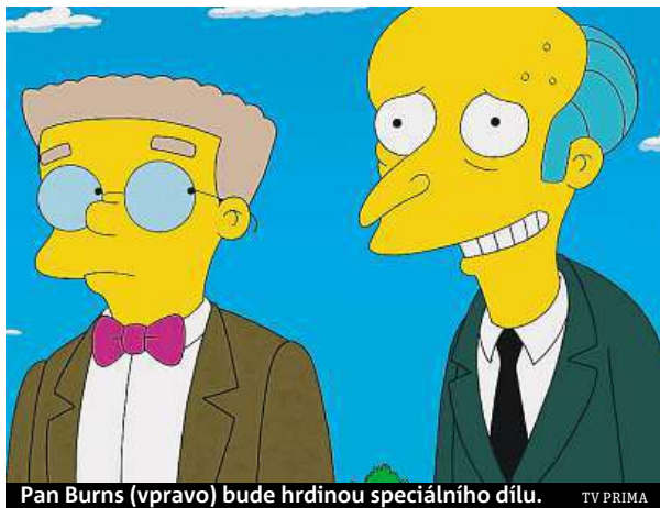
Pan Burns (vpravo) bude hrdinou speciálního dílu.

Namísto jazzové atmosféry 20. let, jež dominovala americkému románu, se v tomto případě diváci dočkají neobvyklého přátelství mezi majitelem springfieldské atomové továrny, panem Burnsem, a hip-hopovým baronem