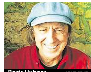
Boris Hybner MIME FEST