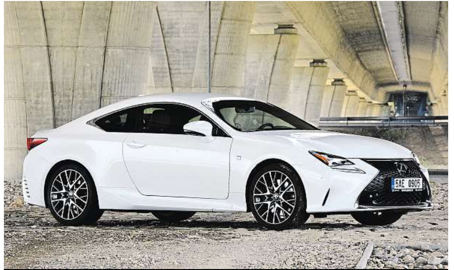
Lexus RC 200t je navenek fešák, ale uvnitř si ho budete také užívat.

Předností testovaného čtyřválcového je docela svižná odezva na přidání plynu, vysoký točivý moment dává už od nízkých otáček. Vůz přitom disponuje maximem výkonu 180 kW (245 koní) a nejvyš-