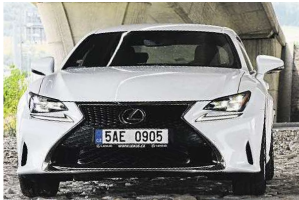
Pokud se vám vůz líbí, připravte si 1,5 milionu korun.

ším točivým momentem 350 Nm. Lexus RC 200t tak akceleruje z 0 na 100 km/h za 7,5 sekundy a rozjede se až na 230 kilometrů za hodinu.