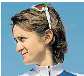
Startu se nedočkala. MAFRA

Arbitři zkoumali předloženou korespondenci mezi Mezinárodní cyklistickou unií