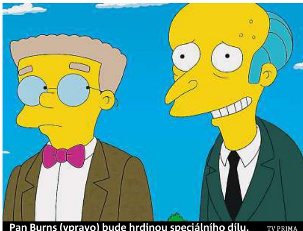
Pan Burns (vpravo) bude hrdinou speciálního dílu.

Namísto jazzové atmosféry 20. let, jež dominovala americkému románu, se v tomto případě diváci dočkají neobvyklého přátelství mezi majitelem springfieldské atomové továrny, panem Burnsem, a hip-hopovým baronem