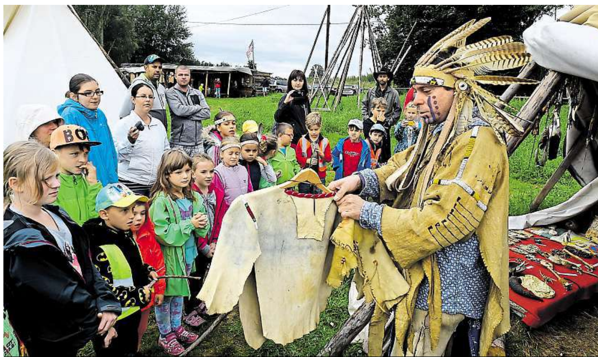
Se životem severoamerických prérijních indiánů se seznámí návštěvníci indiánské vesničky Rosehill v Růžové na Děčínsku.

Stavba rodinného domu. Díky plánu ministerstva bude brzy jednodušší. Konec papírování. Po chystané novele postačí pouze ohlášení stavby. Lhůta vyřízení. Do 30 dnů. Další výhoda. Stavba svépomocí STRANA 2