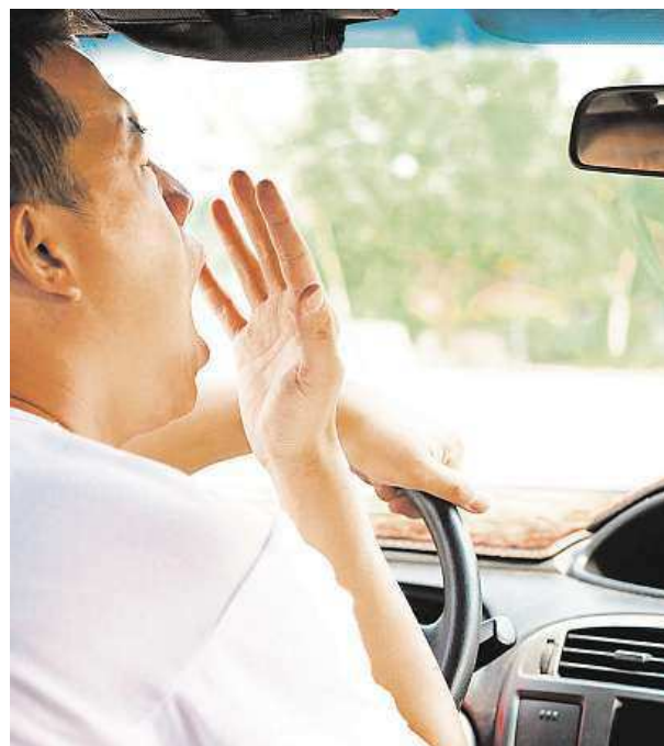
Hned zastavit a protáhnout se!

A pozor, velmi důležitá je i klimatizace. Pokud ji v autě máte, rozhodně si ji zapínejte, ale nepřeženě to. Pokud si totiž vychladíte vnitřek auta přespříliš a poté vystoupíte do horka, vystavujete se zdravotně nebezpečnému tepelnému šoku. Obecně platí, že klimatizace nemá být nastavena na větší rozdíl, než je šest stupňů Celsia oproti venkovní teplotě. „Chladnější vzduch by rozhodně neměl foukat přímo na tělo. Jinak hrozí zatuhnutí například obličejových nebo šíjových svalů. Foukání směrujte spíše nahoru. Před dojezdem na místo doporučuji klimatizaci vypnout a lehce pootevřít okénka, aby se vyrovnala vnitřní a vnější teplota,“ doporučuje Michaela Tomanová. KAMILA HUDEČKOVÁ