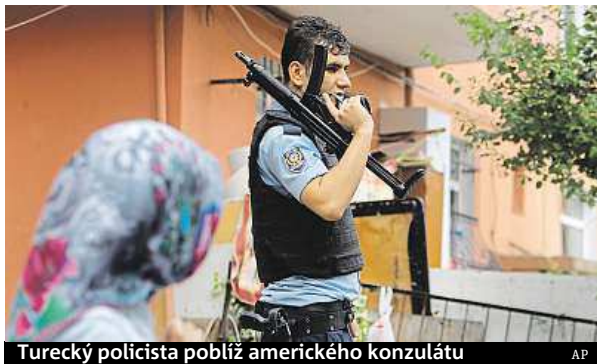
Turecký policista poblíž amerického konzulátu

Dva bombové útoky na policejní stanice a střelba na americký konzulát. Za útoky asi stáli jak levicoví radikálové, tak také stoupenci Islámského státu.