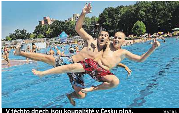
V těchto dnech jsou koupaliště v Česku plná.

„Z kůže a sliznic osob využívajících umělá koupaliště a bazény se smývají do vody nejrůznější tělní tekutiny, pot, moč nebo zbytky kosmetických prostředků, opalovacích krémů a mýdel. To vše může zhoršit kvalitu vody a podporovat množení nejrůznějších mikroorganismů,“ vypočítává dermatoložka Petra Petrovská. Seznam mikroorganismů, kterým nahrávají právě zvýšené teploty, také není zrovna hezkým