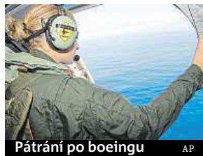
Pátrání po boeingu

Pátrání po pohřešovaném letadle malajsijských aerolinií, které loni i s 239 lidmi na palubě beze stopy zmizelo během letu z Kuala Lumpur do Pekingu, se rozšířilo i na souostroví Maledivy. Malajsijský ministr dopravy oznámil, že na ostrovy v Indickém oceánu vyšle tým expertů, kteří by měli nález prozkoumat a posoudit, zda jde o trosky zříceného Boeingu 777. Už koncem července se našly na francouzském ostrově Réunion úlomky křídla, které podle malajsijských úřadů pocházejí právě z pohřešovaného boeingu. Záhadu týkající se osudu letadla, které zmizelo z leteckých radarů 8. března 2014, už přes rok intenzivně řeší odborníci z několika zemí. ČTK