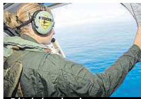
Pátrání po boeingu AP

Pátrání po pohřešovaném letadle malajsijských aerolinií, které loni i s 239 lidmi na palubě beze stopy zmizelo během letu z Kuala Lumpur do Pekingu, se rozšířilo i na souostroví Maledivy. Malajsijský ministr dopravy oznámil, že na ostrovy v Indickém oceánu vyšle tým expertů, kteří by měli nález prozkoumat a posoudit, zda jde o trosky zříceného Boeingu 777. Už koncem července se našly na francouzském ostrově Réunion úlomky křídla, které podle malajsijských úřadů pocházejí právě z pohřešovaného boeingu. Záhadu týkající se osudu letadla, které zmizelo z leteckých radarů 8. března 2014, už přes rok intenzivně řeší odborníci z několika zemí. ČTK