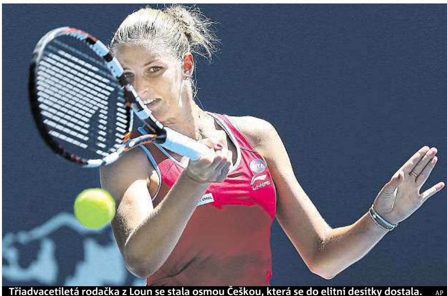
Třidvacetiletá rodačka z Loun se stala osmou Češkou, která se do elitní desítky dostala.

Letos hrála již páté finále, ale titul získala jen v Praze. S Kerberovou prohrála už v červnu na trávě v Birminghamu. „Už jsem jí říkala, že proti ní nechci hrát ve finále, protože to s ní teď mám v zápasech o titul 0:2. Příště chci jinou soupeřku,“ rozesmála Plíšková fanoušky při slavnostním vyhlášení. STM