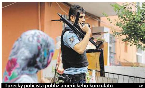
Turecký policista poblíž amerického konzulátu

Tureckem včera otrásla série útoků. Americký konzulát ve čtvrti Sariyer na severu Istanbulu se dostal pod palbu včera ráno. Podle místního guvernéra byly pachatelkami dvě ženy, které bezprostředně po činu utekly, policie poté celou oblast uzavřela. Jednu z údajných útočnic se podařilo zadržet v úkrytu v nedalekém domě, žena měla při přestřelce s policií utrpět zranění. Vyšetřovatelé