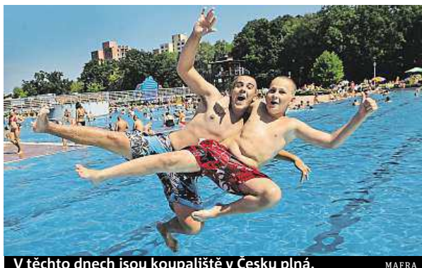
V těchto dnech jsou koupaliště v Česku plná.

„Z kůže a sliznic osob využívajících umělá koupaliště a bazény se smývají do vody nejrůznější tělní tekutiny, pot, moč nebo zbytky kosmetických prostředků, opalovacích krémů a mýdel. To vše může zhoršit kvalitu vody a podporovat množení nejrůznějších mikroorganismů,“ vypočítává dermatoložka Petra Petrovská. Seznam mikroorganismů, kterým nahrávají právě zvýšené teploty, také není zrovna hezkým