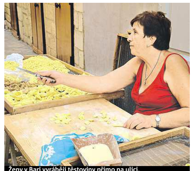
Ženy v Bari vyrábějí těstoviny přímo na ulici.