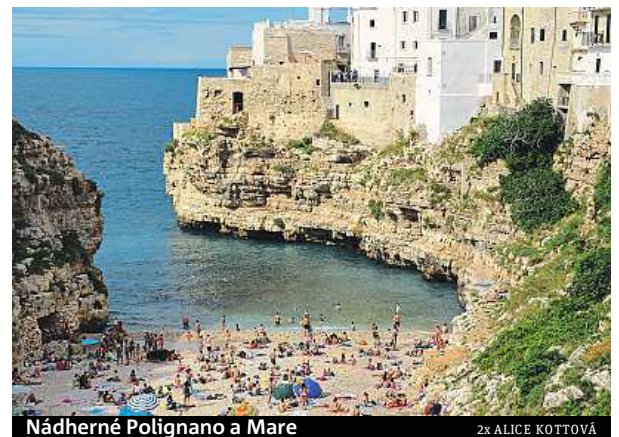
Nádherné Polignano a Mare