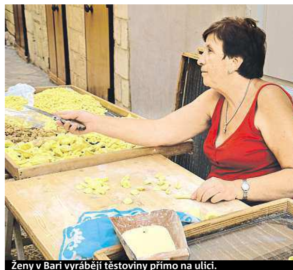
Ženy v Bari vyrábějí těstoviny přímo na ulici.