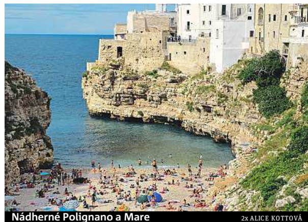
Nádherné Polignano a Mare