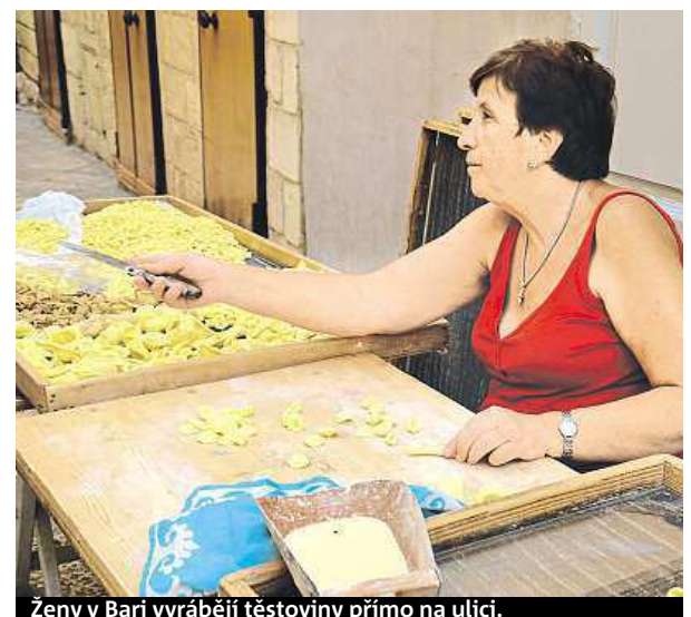
Ženy v Bari vyrábějí těstoviny přímo na ulici.