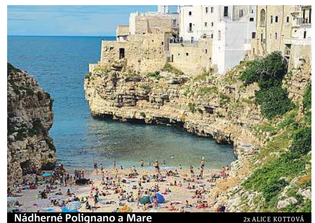
Nádherné Polignano a Mare