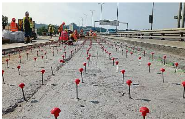
Navrnané železné tyče s krycími „bezpečnostními“ kuličkami. Tyče se posléze svaří s armaturou a tím se propojí starý a nový beton.