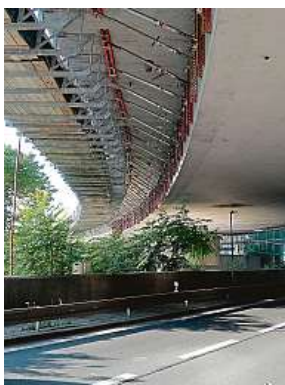
Tady byla zrada. Projevila se až po první části rekonstrukce.