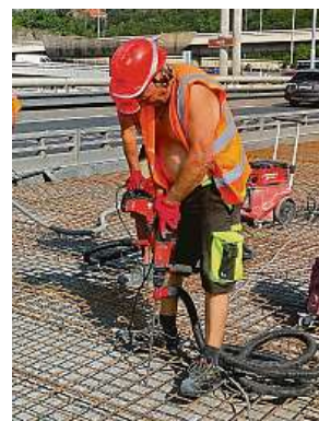
Asi devadesátitřicetkrát museli zatím dělníci vrtnout do mostu.