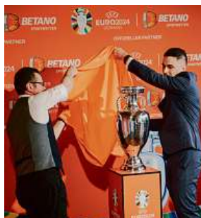
Tým Betano odhaluje pohár UEFA EURO 2024™ na Olympijském stadionu v Berlíně.

sponzorství oddanost společnosti fotbalovému průmyslu. Nejenže reflektují zásady, které definují podnikání společnosti Kaizen Gaming, ale také zdůrazňují společné hodnoty všech zúčastněných organizací.