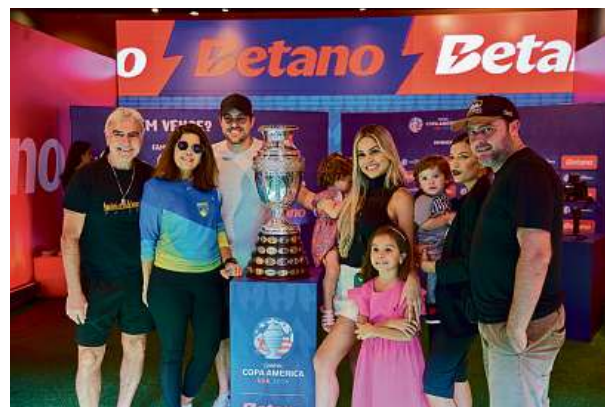
Betano přivezlo trofej CONMEBOL Copa América™ 2024 do brazilského Ria de Janeiro a São Paula.

Betano je také hrdým partnerem některých významných fotbalových klubů v Evropě, včetně FC Porto, Sporting CP a S.L. Benfica v Portugalsku, FCSSB v Rumunsku nebo AC Sparty Praha a FC Viktoria Plzeň v České republice. V nedávné době vstoupila značka Betano také do anglické