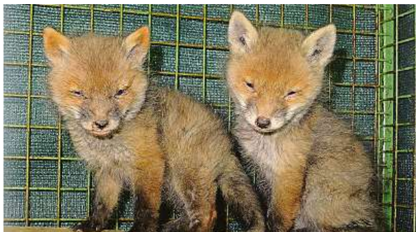
Poslanci mají brzy rozhodnout o krutém způsobu lovu lišek – norování. Novelu o myslivosti čeká dobrodružné hlasování.

„Dobrovolníci v čele se zástupci mysliveckých spolků se usilovně snaží bezmocná srnčata před sekačkami zachraňovat. Přesto jich stovky zahynou krutou smrtí. Na druhou stranu se paradoxně právě myslivci usilovně snaží zachovat tradici úmyslného zabíjení bezmocných liščat,“ říká pro deník Metro Petr Stýblo z ČSOP. Zákon o myslivosti, který nyní míří