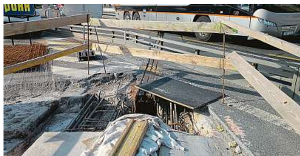
Staré a nové sřazení částí mostu. Do nového už nebude zatékat.