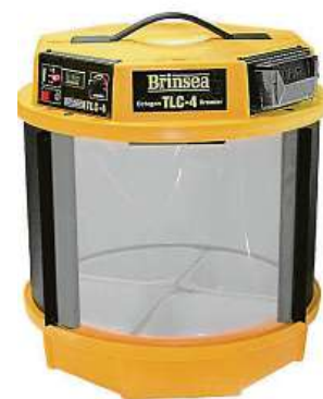
Pro úspěšný odchov ptáčat je důležitý pobyt v inkubátoru.

prkna, aby se ptáci pohodlně napili a neutopili se. „Domácí kutilové a nejen oni si určitě budou vědět rady. Ale postačí i postavit mělkou miskou s vodou na zem tak, aby se nepřevrhla a ptáci i třeba ježci a veverka tak měli jednoduchý přístup k vodě. Tu je v misce třeba jedenkrát denně vyměňovat,“ dodává pro Metro Čechová s tím, že je ale nutné dát pozor na jezírka a bazény s kolmými stěnami. „Také dávejte pozor na konve nebo kbelíky. Nouze o vodu nutí ptáky pít i z těchto zdrojů a hrozí jim utopení,“ doplňuje Čechová.