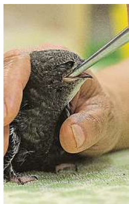
Péče o malé rorýsy je nákladná a náročná.

Malí rorýsi jsou v záchranných stanicích jedni z nejnáročnějších pacientů. Péče o jednoho vyjde v průměru na necelé dva tisíce korun. Coby výhradní hmyzožravci totiž potřebují pestrou stravu v podobě speciálních směsí. Těmi se krmí zhruba sedm dní. Pak mohou přejít na dracené červy, cvrčky, kuřecí srdíčka a další podobné laskominy. „Délka odchovu rorýsa od úplného mimina bývá 40 až 45 dní, protože se však do stanic dostávají většinou už vzrostlá mláďata, délka pobytu v zajetí je necelých deset dní. Pro úspěšný odchov malých ptáčat je extrémně důležitý pobyt ve speciálním inkubátoru. Úspěšnost se s jeho pomocí zvýší až o polovinu. Pro řadu stanic je však pořízení inkubátoru v ceně okolo patnácti tisíc korun ne-reálné,“ uzavírá Stýblo.