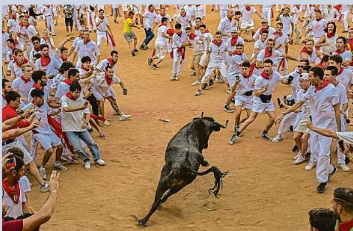
Při tradiční akci jsou účastníci většinou pohmoždění. Běhy s býky jsou populární také u Američanů, kteří se jich s oblibou čím dál častěji účastní.

Tradiční oslavy svátku svatého Fermína, jejichž součástí jsou běhy s býky v ulicích města, v baskické Pamploně pokračují. Do věřejšího odpoledne bez úmrtí účastníků této události. Akce, která začala v pátek, si opět vyžádala jen zraněné. Úmrtí jsou relativně vzácná. Poslední bylo zaznamenáno v roce 2009. Ranní běhy s býky ulicemi historického města potrvají do soboty. Akce, již proslavil americký spisovatel Ernest Hemingway v románu I slunce vychází, se účastní velký počet lidí ze zahraničí. ČTK