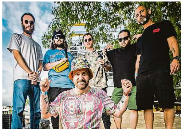
Prago Union zahrají ve čtvrtek v Praze průřez tvorby kapely. Připojí se také Krotitelé Dechů. ROMAN ČERNÝ

Prago Union po boku Krotitelů Dechů fanouškům v Ledárnách Braník zahrají průřez celou historií, včetně velkého množství skladeb, které dosud při živém hraní nedostaly prostor.