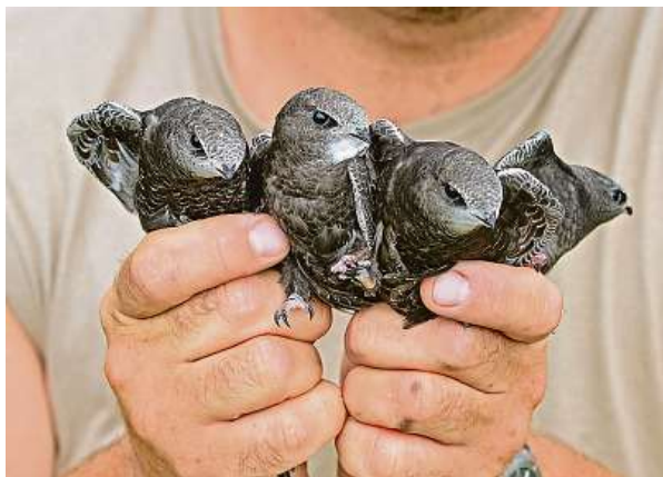
Jedno či více rorýsích mláďat lze zachránit buďto prostřednictvím webu daruj.zvirevnouzi.cz , či darovací SMS zprávou.

Jestliže jste majitelem bazénku, jezírka nebo něčeho podobného, stačí podle ochránců jen umožnit ptákům přístup k vodě. A to úplně jednoduše za pomoci plovoucího