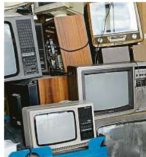
Je lepší, když skončí ve sběrném dvoře než na ulici.

Co si ale počít, když se někdo spotřebiče jen zbavuje, a nechce kupovat další? Pokud ho odloží u kontejnerů, nemůže počítat s tím, že ho odpadové služby naloží a odvezou. Nepatří to k jejich povinnostem. „Občas se to u nás stáva-