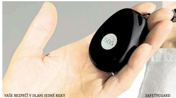
VAŠE BEZPEČÍ V DLANI JEDNÉ RUKY

Na složitou manipulaci s chytrými telefony klidně zapomeňte. 24h Monitorovací centrum bdí nad svými uživateli nepřetržitě, čímž zajišťuje pomoc opravdu kdykoliv. SOS Přívěsek je vybaven SIM kartou, což umožňuje snadnou komunikaci s uživateli přímo přes SOS Přívěsek. Je navíc připraven i na tak ošemetné terény, jako je koupelna. Je totiž vo-