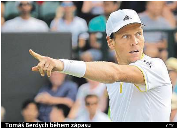
Tomáš Berdych během zápasu

Nadprůměrný servis a drtivý forhend dovedly Berdycha k výhře nad Thiemem. Jednatřicetiletý Berdych hrál od prvních míčů aktivně a naznačil prvky překvapení. Vydařoval se tu a tam k síti, jen pokus o zkrácení nevyšel. Především ale spoléhal na servis, při kterém dlouho nepřipouštěl ani zárodky problémů. Forhendem vymetal rohy.