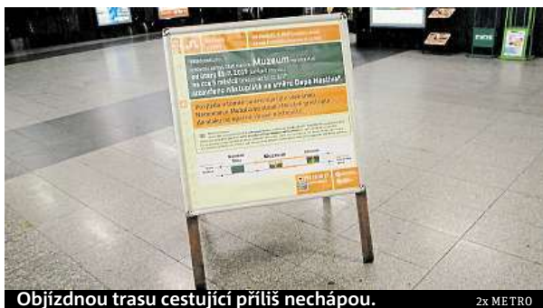
Objíždnou trasu cestující příliš nechápou.