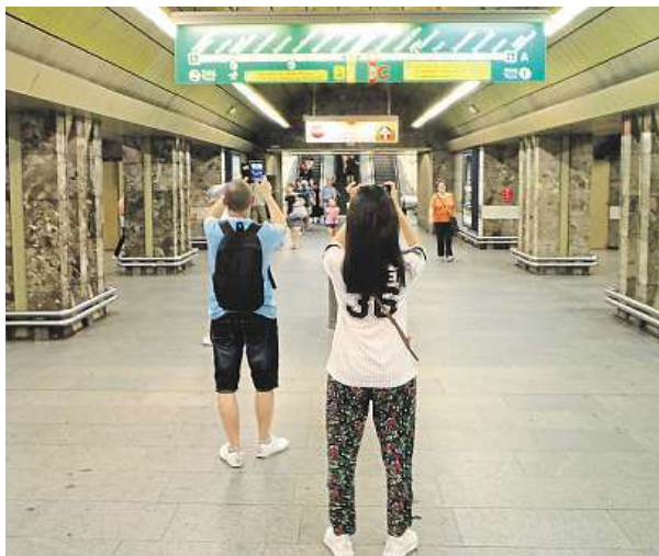
Informace o výluce a plán objíždky si hodně lidí fotilo.

Možných prostožů spojených s výlukou se bojí ne jeden Pražan. Cesta mezi stanicí Můstek a Muzeem zabere sama o sobě přibližně minutu, podobně je tomu i v případě přejezdu z Muzea na Ná-