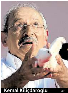
Kemal Kiliçdaroglu

Zatykače souvisejí s vyšetřováním hnutí duchovního Fethullaha Gülena, kterého prezident označil za strůjce loňského červencového pokusu o státní převrat. Všichni podezřelí užívají aplikaci By-