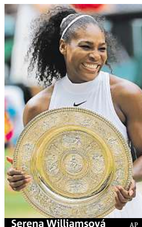
Serena Williamsová

Vydařeně vystoupení v Londýně korunovala Serena i ve