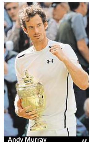
Andy Murray

čtyřhře, v níž triumfovala se starší sestrou Venus. Společně porazily párou nasazenou maďarsko-kazašskou dvojici Tímea Babosová, Jaroslava Švedovová 6:3, 6:4 a získaly šestý wimbledonský titul.