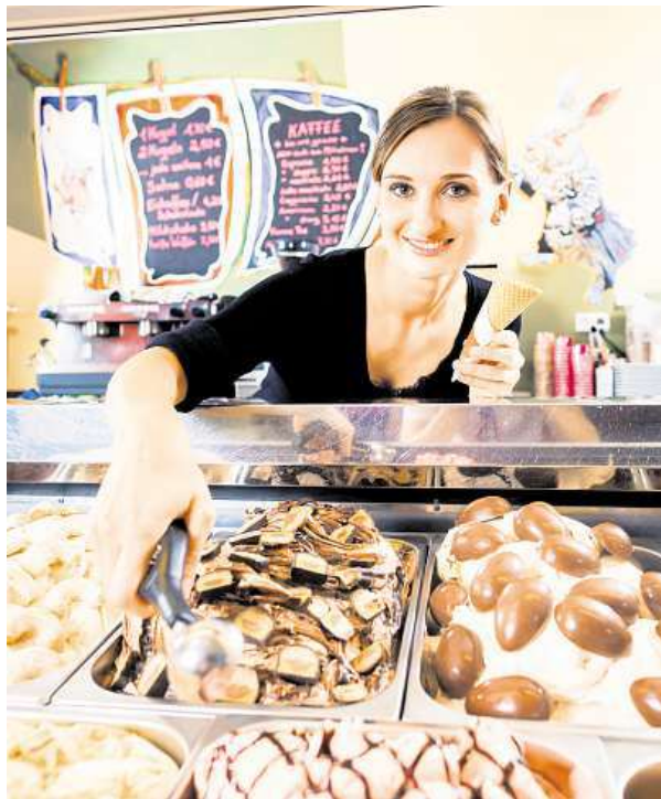
Studentka na letní brigádě

„Dohoda o provedení práce je typ pracovního poměru, který je pro studenty nejvýhodnější. Pokud váš měsíční výdělek nepřesáhne deset tisíc, nestrhává se vám ani zdravotní ani sociální pojištění. Přijde vám tak čistá mzda bez jakýchkoliv srážek,“ říká Sobková. To ale platí pouze v případě, že jste student, stáhne se vám tedy zdravotní a sociální pojištění, a v případě, že jste podepsali přihlášení k dani. Pokud jste toto ružové prohlášení nepodepsali, bez ohledu na výši výdělku, strhne se vám patnáctiprocentní srážková daň. „Pokud ovšem váš výdělek za měsíc deset tisíc přesáhne, strhne se vám zdravotní i sociální po-