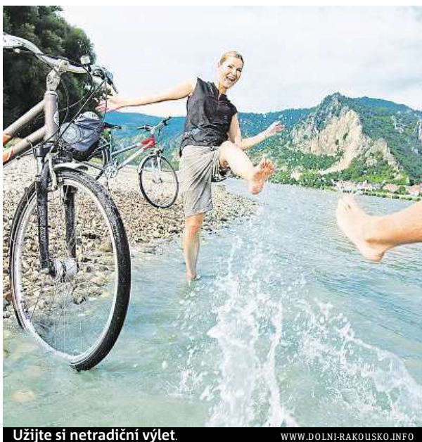
Užijte si netradiční výlet.