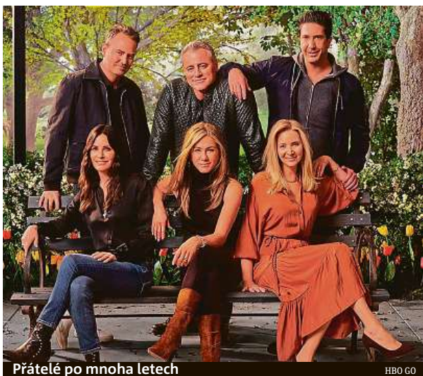
Přátelé po mnoha letech

Ze speciálu například vyplynulo, že na place probíhal platonický románek mezi Rossem a Rachel (David Schwimmer a Jennifer Anistonová). Anistonová po odvážné otázce moderátora Jamese Cordena přiznala, že své city s kolegou Schwimmerem jako Ross a Rachel nemuseli moc předstírat. Svůj první polibek si nicméně museli schovat před kameru. Podle herců spolu totiž nikdy nic neměli proto, že měl vždycky jeden či druhý dlouhodobý vztah.