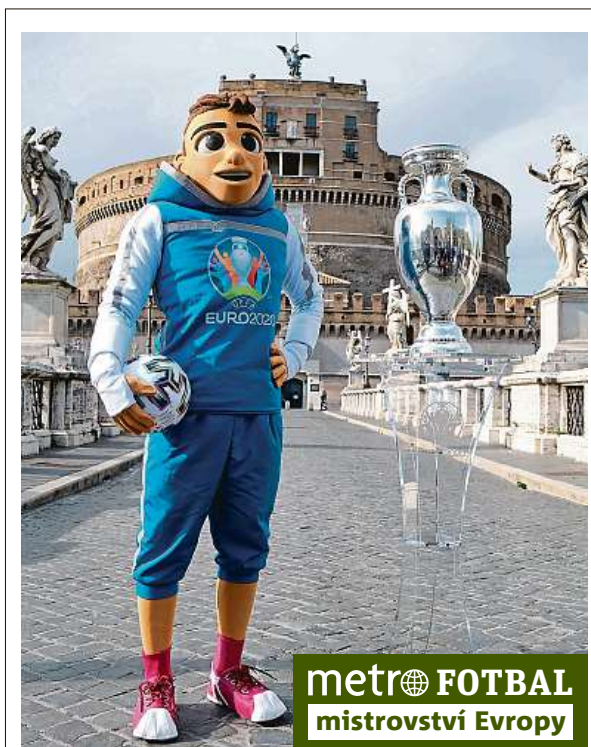
metro FOTBAL mistrovství Evropy

Stadion, na kterém v minulosti hrávala ligové zápasy například pražská Slavia, se „oblékl“ do barev Eura. Kolem trávníku vyrostly bannery tyrkysové barvy s nápisem „UEFA Euro 2020“ a „Czech Republic“ a reklamní cedule se sponzory šampionátu. Zítřejí Češi vyrazí do Skotska k prvnímu zápasu na ME, který je čeká v pondělí.