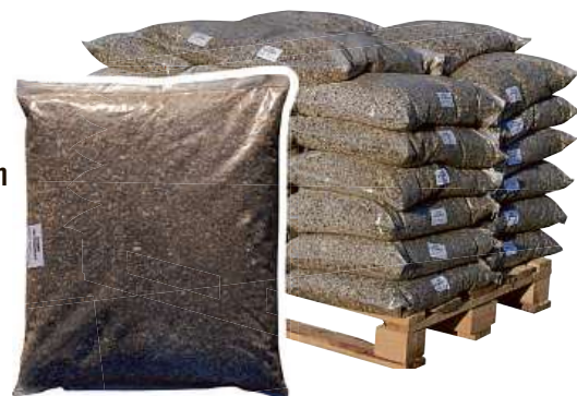
Štěrk - frakce 4-8 mm - bal. 25 kg 7245364