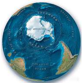
Kolem Antarktidy NASA

Moře kolem Antarktidy nyní ponese pojmenování Jižní oceán, uvedla kartografická společnost National Geographic na Twitteru.