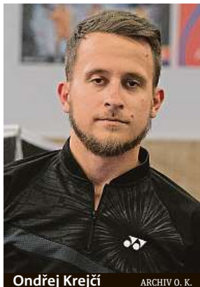
Ondřej Krejčí ARCHIV O. K.

Zápasy probíhají v místě, na kterém se oba hráči domlu-