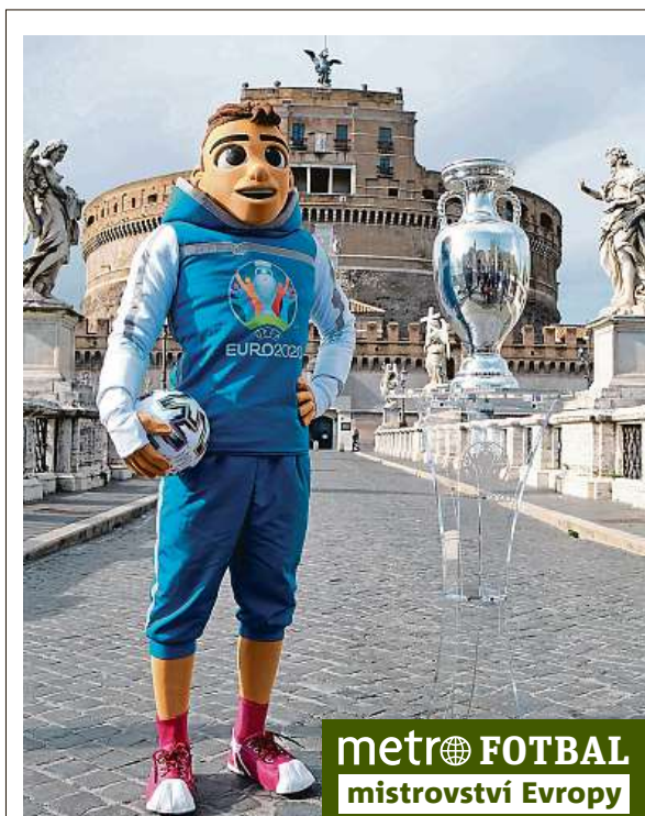
metro FOTBAL mistrovství Evropy

Stadion, na kterém v minulosti hrávala ligové zápasy například pražská Slavia, se „oblékl“ do barev Eura. Kolem trávníku vyrostly bannery tyrkysové barvy s nápisem „UEFA Euro 2020“ a „Czech Republic“ a reklamní cedule se sponzory šampionátu. Zítřejí Češi vyrazí do Skotska k prvnímu zápasu na ME, který je čeká v pondělí.