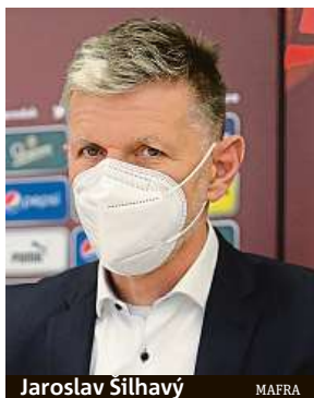
Jaroslav Šilhavý MAFRA

Hraje se netradičně po celém kontinentu. Jde o počtu k výročí od prvního evropského šampionátu v roce 1960. To sice odsunutím na letošek už neplatí, ale model zůstal stejný. Dokonce UEFA dál pra-