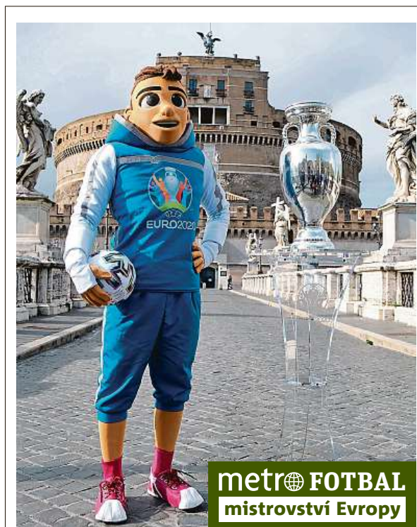
metro FOTBAL mistrovství Evropy

Stadion, na kterém v minulosti hrávala ligové zápasy například pražská Slavia, se „oblékl“ do barev Eura. Kolem trávníku vyrostly bannery tyrkysové barvy s nápisem „UEFA Euro 2020“ a „Czech Republic“ a reklamní cedule se sponzory šampionátu. Zítřejí Češi vyrazí do Skotska k prvnímu zápasu na ME, který je čeká v pondělí. ČTK