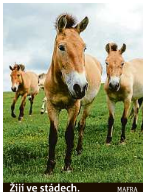
Žijí ve stádech.