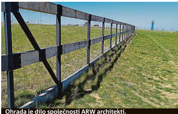
Ohrada je dílo společnosti ARW architekti.