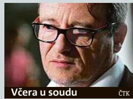
Včera u soudu ČTK

Jedna z větví korupční kauzy kolem exhejtmana a poslance Davida Ratha pokračuje. Včera státní zástupkyně požádala o vyšší majetkové tresty pro býva-