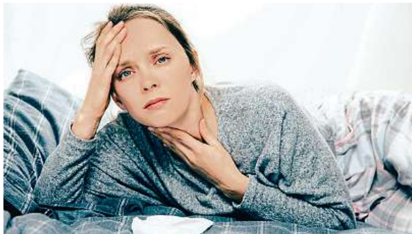
Občas je v pracovní neschopnosti každý.

Třetina nemocensky pojištěných osob pracuje ve velkých firmách s 500 a více zaměstnanci, obdobný podíl je i pojištěných pracujících ve fir-