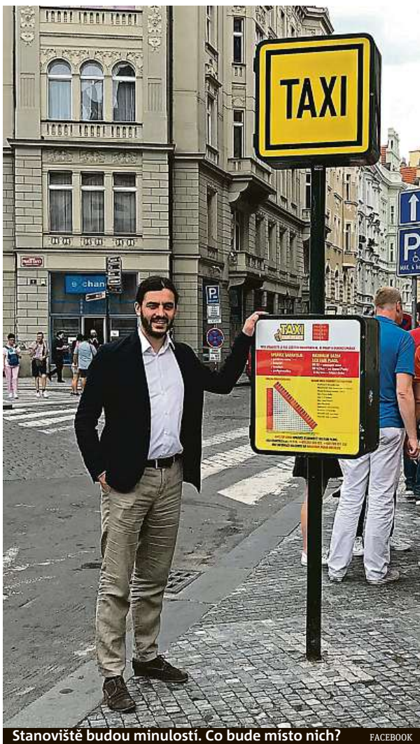
Stanoviště budou minulostí. Co bude místo nich? FACEBOOK

Na stanovištích u křížení Václavského náměstí s Jindřišskou ulicí se během čtyř let udělalo celkem čtyřadvacet takzvaných namátkových „mystery shoppingů“. „Taxíky se svezly magistralní figurant, a pouze pět z nich nebylo úmyslně předražených. Ve