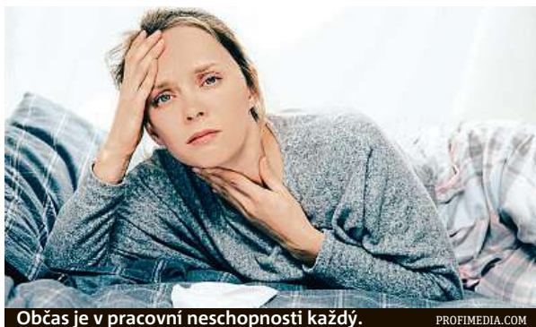
Občas je v pracovní neschopnosti každý.

Třetina nemocensky pojištěných osob pracuje ve velkých firmách s 500 a více zaměstnanci, obdobný podíl je i pojištěných pracujících ve fir-