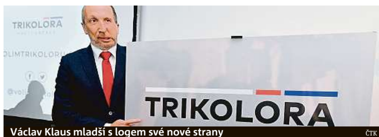
Václav Klaus mladší s logem své nové strany