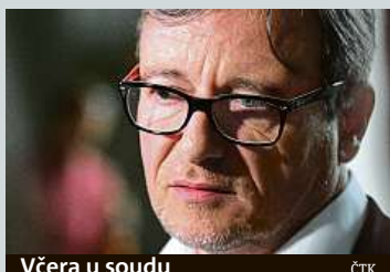
Včera u soudu