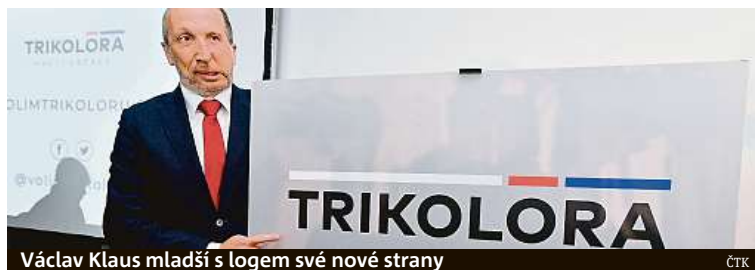
Václav Klaus mladší s logem své nové strany