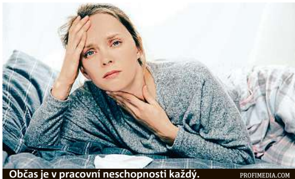
Občas je v pracovní neschopnosti každý.

Třetina nemocensky pojištěných osob pracuje ve velkých firmách s 500 a více zaměstnanci, obdobný podíl je i pojištěných pracujících ve fir-