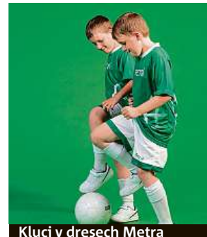
Kluci v dresech Metra