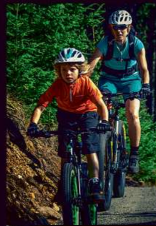
Trail Park Klínovec