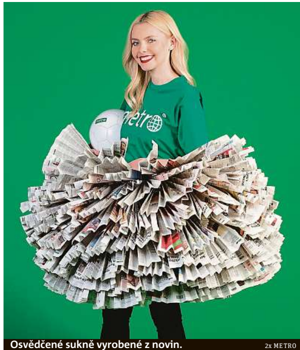
Osvědčené sukne vyrobené z novin.

Jejich autoři získají 300 nebo 500 korun. Pětice autorů vybraných snímků dostane také věcné ceny – mikinu, deštník a fotbalový míč. MET