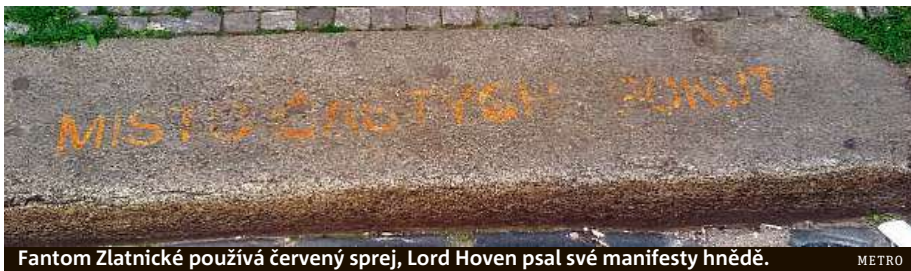
Fantom Zlatnické používá červený sprej, Lord Hoven psal své manifesty hnědě.

Identita osoby, která v centru varuje řidiče před pokutami, je strážníkům dodnes neznámá.