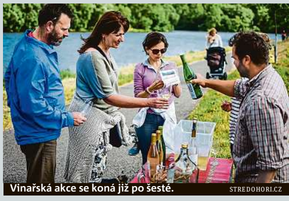
Vinařská akce se koná již po šesté.

Celé putování zahrnuje katedrálu sv. Štěpána, věž u katedrály, kostel Zvěstování Panny Marie, kostel Všechných svatých, kostel sv. Jakuba, vyhlídku Kalich na Mírovém náměstí, Diecézní muzeum a sousední Severočeskou galerii výtvarného umění. MET