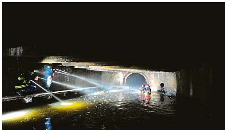
Hasiči hledají pohřešovaného muže v podzemní části Motolského potoka.

Jen pár stovek metrů od místa neštěstí se ulice proměnily v řeku, například Lidická (na snímku). Smíchov to odnesl nejvíce z celé Prahy. Fotografie nám poslala čtenářka, která za ni dostává odměnu. SOŇA SOPKOVÁ