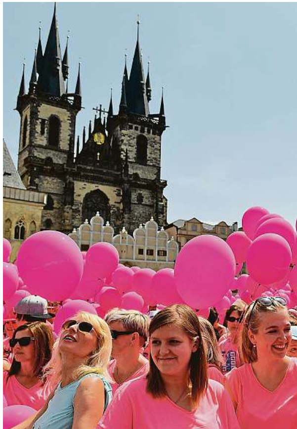
Pochod proti rakovině prsu na Staroměstském náměstí