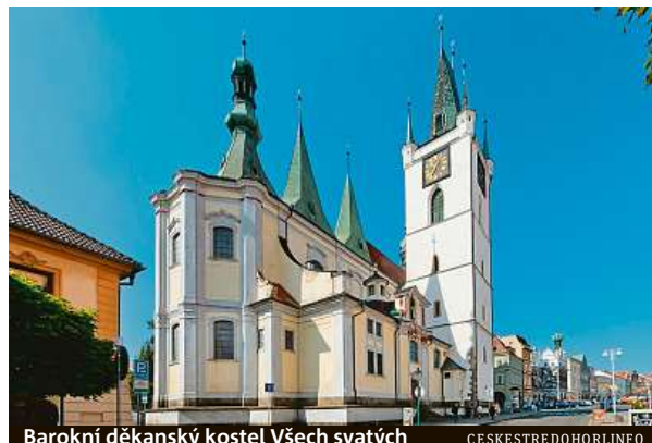
Barokní děkanský kostel Všechných svatých

Na těchto místech jsou také k dispozici průvodci, kteří dle aktuální poptávky návštěvníků zajišťují odborný