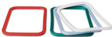
IKEA 365+, těsnění. 79,-/4 ks Silikonová pryž. 20,2x14,4 cm.