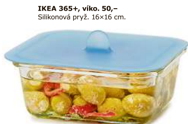
IKEA 365+, víko. 50,- Silikonová pryž. 16x16 cm.