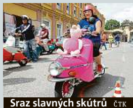
Sraz slavných skútrů ČTK

Řev motorů burácel v sobotu odpoledne částí Prostějova. Projíždělo tudy několik desítek čezet. Význační československých skútrů nezaměnitelného vzhledu vyráběných v 50. a 60. letech mířili na exkurzi do továrny, kde se nyní vyrábí moderní nástupce. Ten je naopak téměř bezhlučný, pohání ho totiž elektromotor na baterie. Fanouškům prasat se nový skútr líbí, až na tu cenu. Motorka na elektřinu totiž stojí od 255 tisíc korun. IDNES.cz