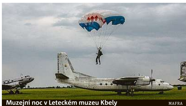
Muzejní noc v Leteckém muzeu Kbely MAFRA