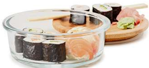
IKEA 365+, dóza na potraviny s víkem. 89,- Sklo, bambus, silikonová pryž. 450 ml.

Nabídka platí pouze do vyprodání zásob. Všechny uvedené údaje mají pouze informativní charakter a nepředstavují návrh na uzavření smlouvy (nabídku) ani veřejný příslib. Změny v důsledku tiskových chyb jsou vyhrazeny. © Inter IKEA Systems B.V. 2018.