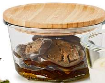
IKEA 365+, dóza na potraviny. 59,-/ks Sklo. 600 ml.