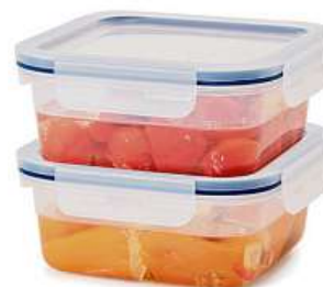
IKEA 365+, dóza na potraviny s víkem. 49,-/ks Plast. 15x15, v. 7 cm.