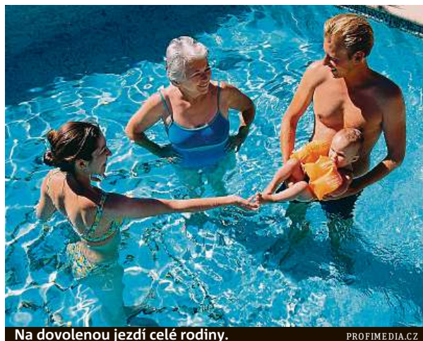
Na dovolenou jezdí celé rodiny.