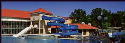
Aquaforum Františkovy Lázně