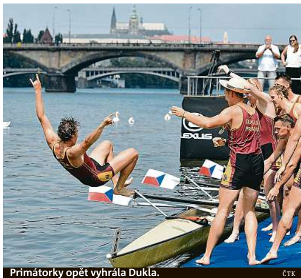
Primátorky opět vyhrála Dukla. ČTK

Tisíce lidí s růžovými balonky a tričky se v sobotu zúčastnily pochodu proti rakovině prsu. Smyslem růžového průvodu je podpořit ženy, které bojují s rakovinou prsu, a zvýšit povědomí veřejnosti o možnostech prevence. Během 18 let, kdy se pochod koná, se na boj proti nemoci získalo více než 110 milionů korun. Včera se na Vltavě konal 105. ročník Primátorek, zvítězila favorizovaná osmičlenná družstva pražské Dukly. ČTK