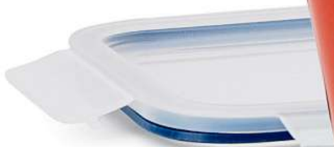
IKEA 365+, víko. 20,- Plast, silikonová pryž.