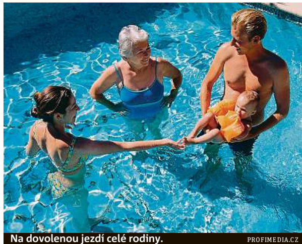
Na dovolenou jezdí celé rodiny.