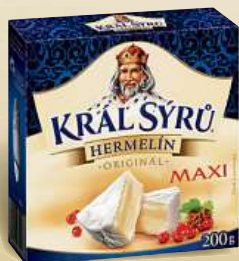
Král sýrů maxi 200 g