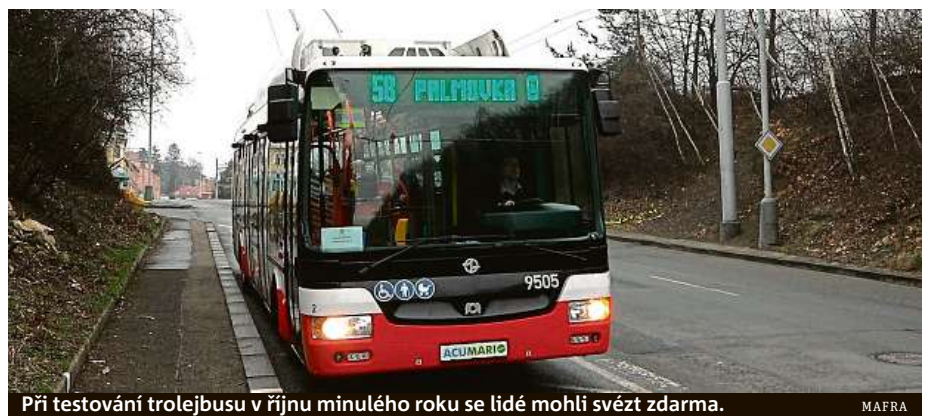
Při testování trolejbusu v říjnu minulého roku se lidé mohli svést zdarma.

DPP už v minulosti testoval elektrobusy několikrát, nikdy ale nešlo o vozy, které by se na své trase připojovaly k troleji. Testovalo se loni, předloni i v roce 2014. Tehdy ale vůz ujel na jedno nabití málo kilometrů. V hlavním městě vyjel první trolejbus před více než 80 lety, přesně 9. srpna 1936. První linka vyjela od tramvajové vozovny Střešovice a trolejbusy jezdily v Praze přes 30 let. Poslední vyrazil od vinohradské Orionky v neděli 15. října 1972. ČTK