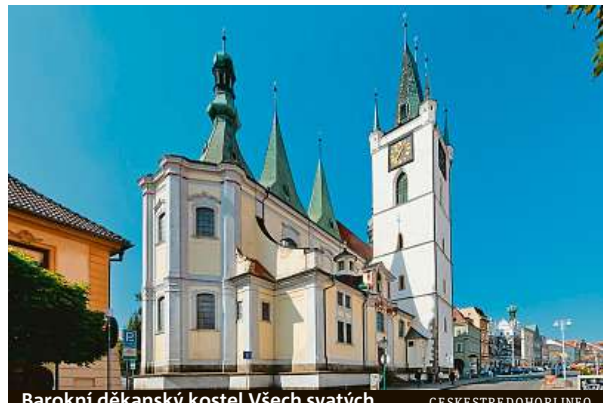
Barokní děkanský kostel Všem svatých

Na těchto místech jsou také k dispozici průvodci, kteří dle aktuální poptávky návštěvníků zajišťují odborný