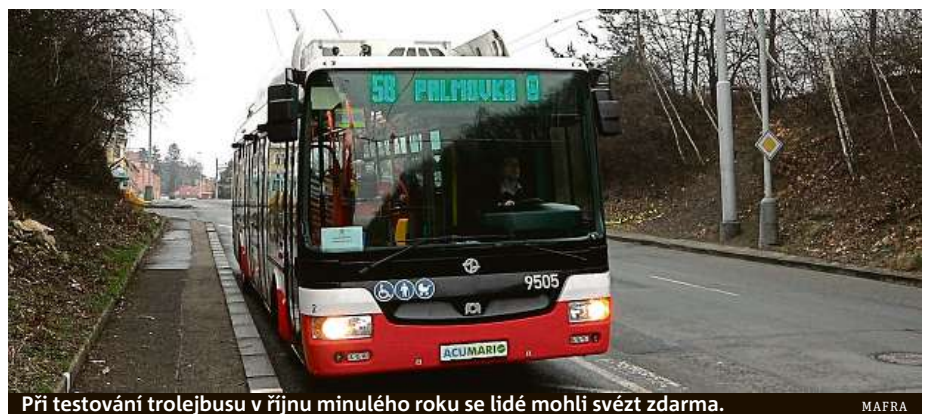
Při testování trolejbusu v říjnu minulého roku se lidé mohli svést zdarma.

DPP už v minulosti testoval elektrobusy několikrát, nikdy ale nešlo o vozy, které by se na své trase připojovaly k troleji. Testovalo se loni, předloni i v roce 2014. Tehdy ale vůz ujel na jedno nabití málo kilometrů. V hlavním městě vyjel první trolejbus před více než 80 lety, přesně 9. srpna 1936. První linka vyjela od tramvajové vozovny Střešovice a trolejbusy jezdily v Praze přes 30 let. Poslední vyrazil od vinohradské Orionky v neděli 15. října 1972. ČTK