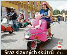
Sraz slavných skútrů ČTK

Řev motorů burácel v sobotu odpoledne částí Prostějova. Projíždělo tudy několik desítek čezet. Význační československých skútrů nezaměnitelného vzhledu vyráběných v 50. a 60. letech mířili na exkurzi do továrny, kde se nyní vyrábí moderní nástupce. Ten je naopak téměř bezhlučný, pohání ho totiž elektromotor na baterie. Fanouškům prasat se nový skútr líbí, až na tu cenu. Motorka na elektřinu totiž stojí od 255 tisíc korun. IDNES.cz