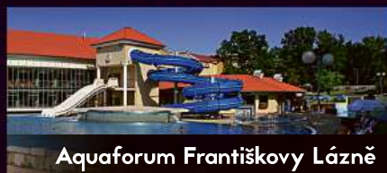
Aquaforum Františkovy Lázně