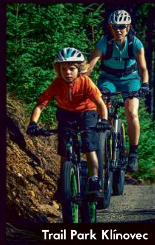
Trail Park Klínovec