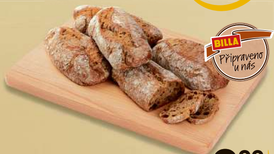
Bochánek venkovský tmavý z naší pekárny 1 ks, 100 g