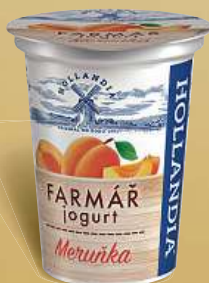
Hollandia Farmář jogurt 400 g, 2 druhy