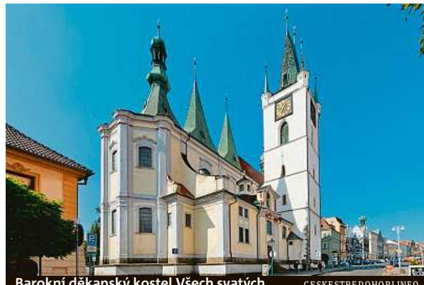
Barokní děkanský kostel Všechných svatých

Na těchto místech jsou také k dispozici průvodci, kteří dle aktuální poptávky návštěvníků zajišťují odborný