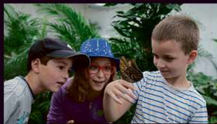
Rozhledna Diana, Motýlí dům