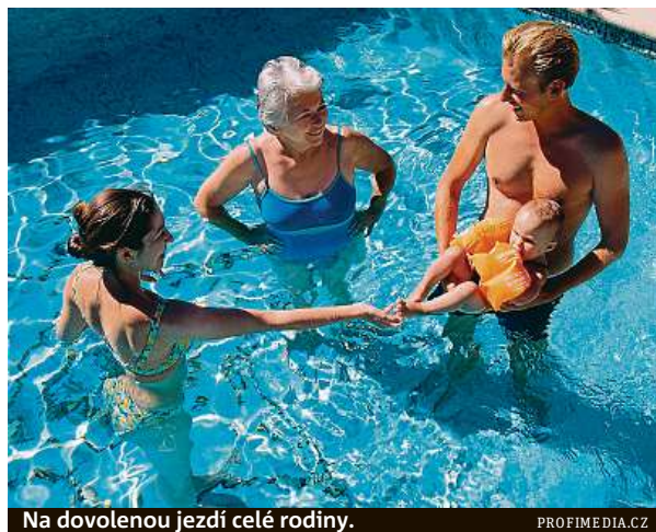
Na dovolenou jezdí celé rodiny.

Průzkum ale také ukázal zajímavý trend. Lidé nad 65 let po dovolené na pláži tolik netouží. Za preferovanou destinaci ji označilo jen 23 procent z nich. Rádi ale cestují po vnitrozemí, mírný pás označilo za ideální téměř 22 procent seniorů. „Lidé ve starším věku pravděpodobně více zvažují zdravotní rizika, která jim mohou hrozit v exotických destinacích i během dlouhého cestování,“ komentoval trend Vladimír Fuchs ze společnosti Europ Assistance. Jeho slova potvrzují výsledky