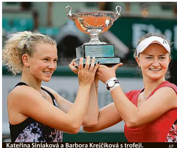
Kateřina Siniaková a Barbora Krejčíková s trofejí.

„Jsme šťastné, jak jsme to zvládly. Ve finále se to sešlo úplně úžasně a je neuvěřitelné, že budeme na trofeji zapsané i za padesát let,“ řekla Krejčíková na kurtu a připomněla i loni zesnulou Janu Novotnou, která ji v minulosti trénovala. „Ráda bych vítězství věnovala Janě Novotné,“ dodala Krejčíková.