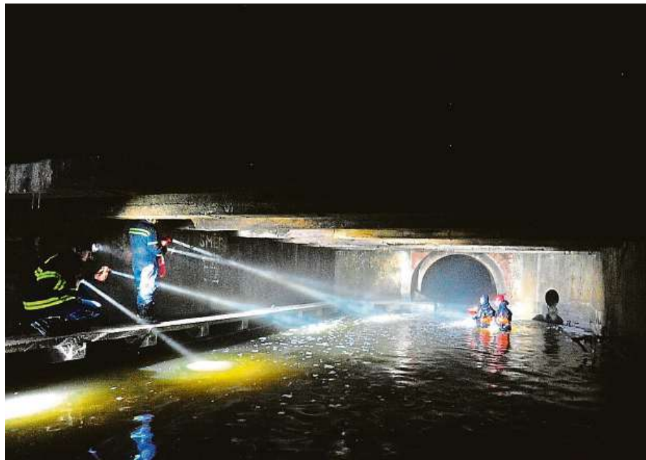
Hasiči hledají pohřešovaného muže v podzemní části Motolského potoka v Praze.