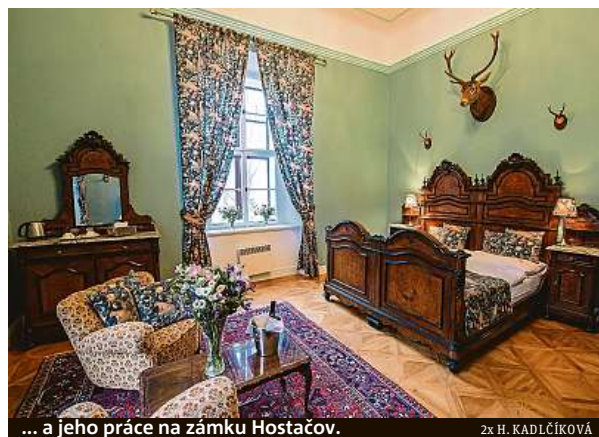
... a jeho práce na zámku Hostačov.