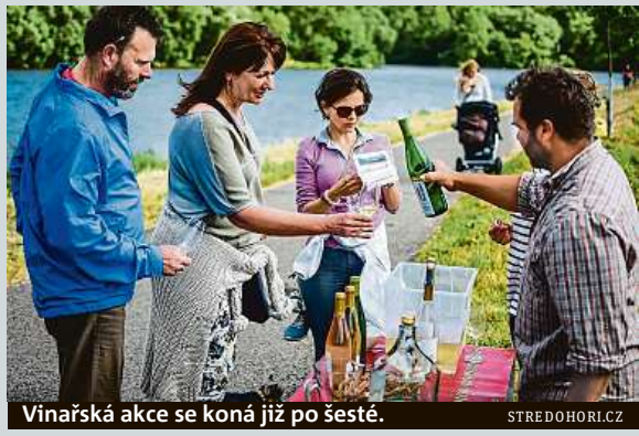
Vinařská akce se koná již po šesté.

Celé putování zahrnuje katedrálu sv. Štěpána, věž u katedrály, kostel Zvěstování Panny Marie, kostel Všechných svatých, kostel sv. Jakuba, vyhlídku Kalich na Mírovém náměstí, Diecézní muzeum a sousední Severočeskou galerii výtvarného umění. MET