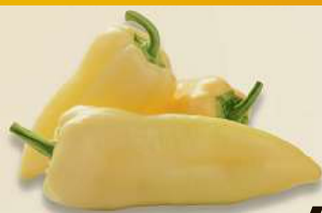
Paprika bílá 1 kg Maroko