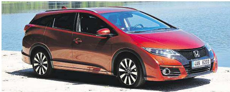
Honda Civic je model, který vyniká futuristickým designem.

tá raketa a se 140 koňmi tak i jezdí. S automatickou převodovkou ovšem podle něj bere 8,5 litru na sto kilometrů, což však se zaběhnutým motorem může klesnout. Ve vylepšeném kombi od Hondy si vedle futuristického designu jak zvenčí, tak uvnitř pochvaluje i další přednosti, kterými se Civic pyšnil už v minulých modelů – geniální systém sklápění zadních sedaček vzhůru, kdy jedním tahem vykouzlíte prostor velikosti malého bunkru.