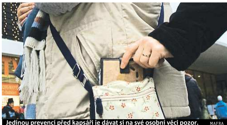
Jedinou prevencí před kapsáři je dávat si na své osobní věci pozor.

Nejdřív údiv, pak vztek. Tak reagujeme, když zjistíme, že nás okradl kapsář.