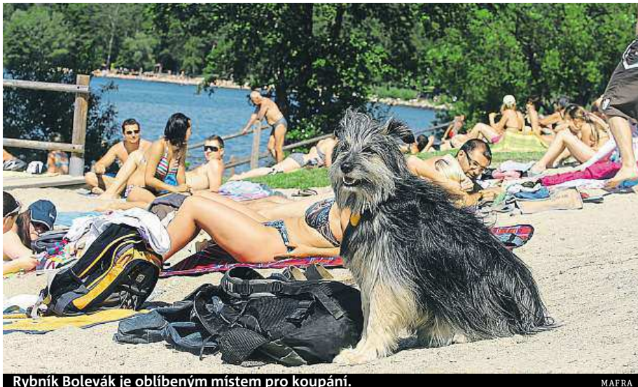
Rybník Bolevák je oblíbeným místem pro koupání.

Když „olajkujete“ facebookovou stránku Bolevecké rybníky, budete pravidelně získávat informace o kvalitě vody v rybníku a také se můžete dozvědět novinky z podvodního světa největšího plzeňského