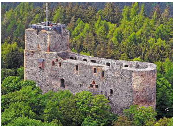
Letecký pohled na hrad Radyně

„Nevyhovovala věž, protože sem pršelo. Třikrát se musela opravovat. Potíž byla taky s tím, že místnost nemě-