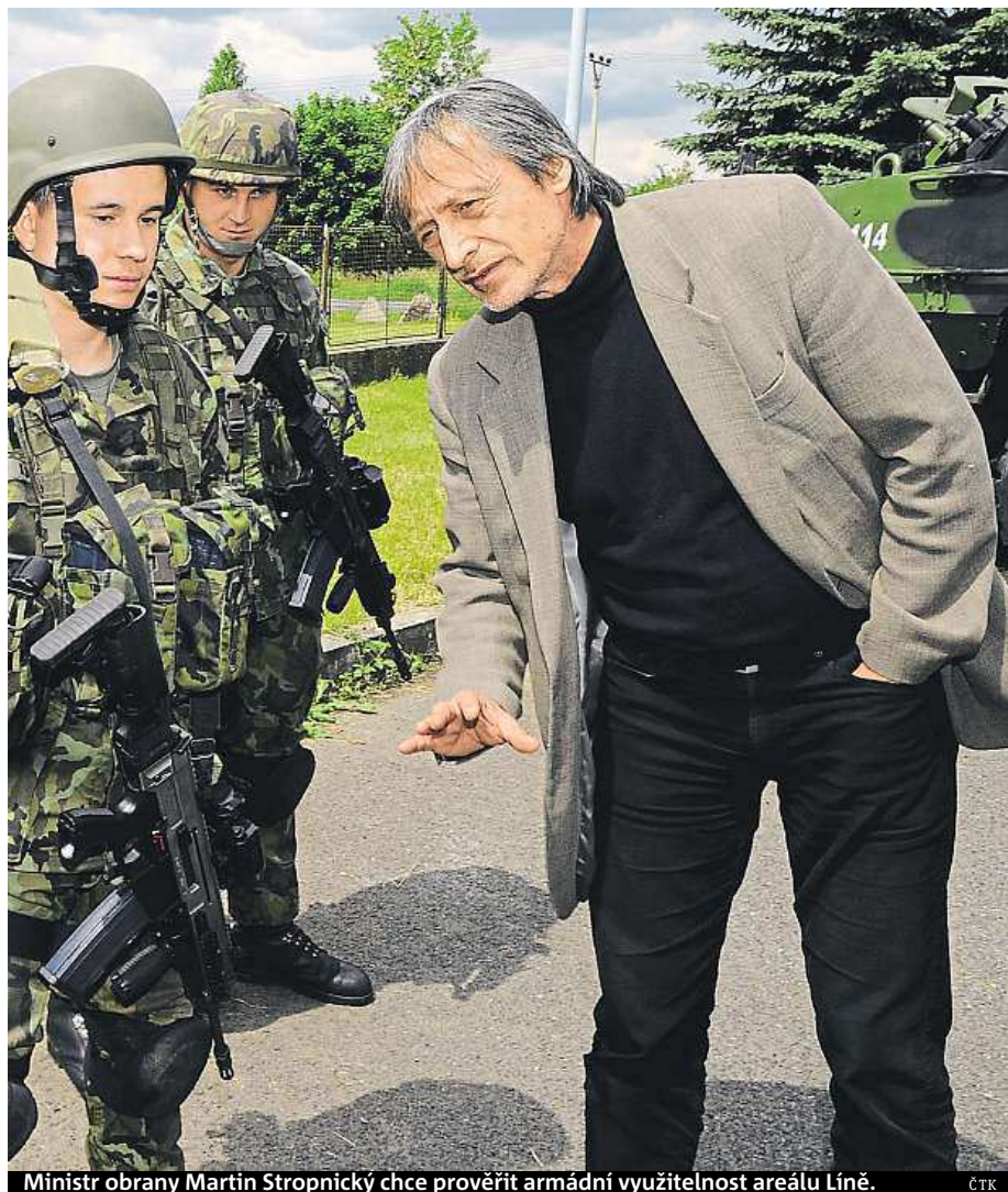
Ministr obrany Martin Stropnický chce prověřit armádní využitelnost areálu Líně.

Nejvíce roste v současné době průmyslová zóna Panattoni Park ve Stříbru na Tachovsku, která profituje především díky poloze těsně vedle dálnice D5. Firma Ideal Automotive tam zaměstná skoro 600 lidí a americký Stelcase, který je světovým výrobcem kovového kancelářského nábytku, tam buduje továrnu, kde najde práci dalších 300 lidí. mš