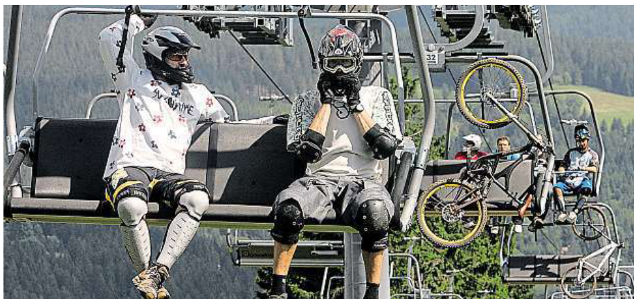
Cyklisty vyveze nahoru sedačková lanovka.