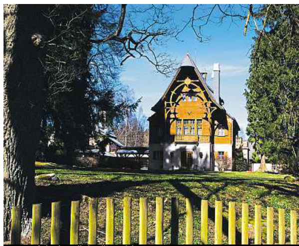
Lovecký zámek Tři trubky