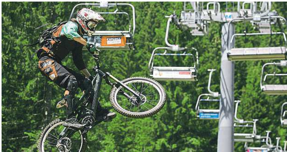
O adrenalinu není v bikeparku na Špičáku nouze.

„Na ochoz rozhledny by se mělo vejít přibližně 60 osob a výhled bude do širokého okolí Šumavy, při dobré viditelnosti by měly být vidět i Alpy,“ doplňuje místopředseda TJ SA Špičák Michal Linhart. MARTIN ŠTĚRBA