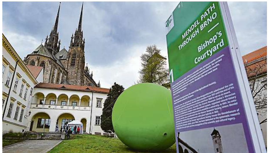
Při příležitosti Mezinárodního dne DNA a oslav narození zakladatele genetiky Gregora Johanna Mendela otevřeli v Brně Mendelovu stezku.