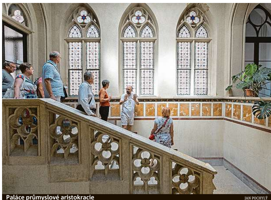
Paláce průmyslové aristokracie