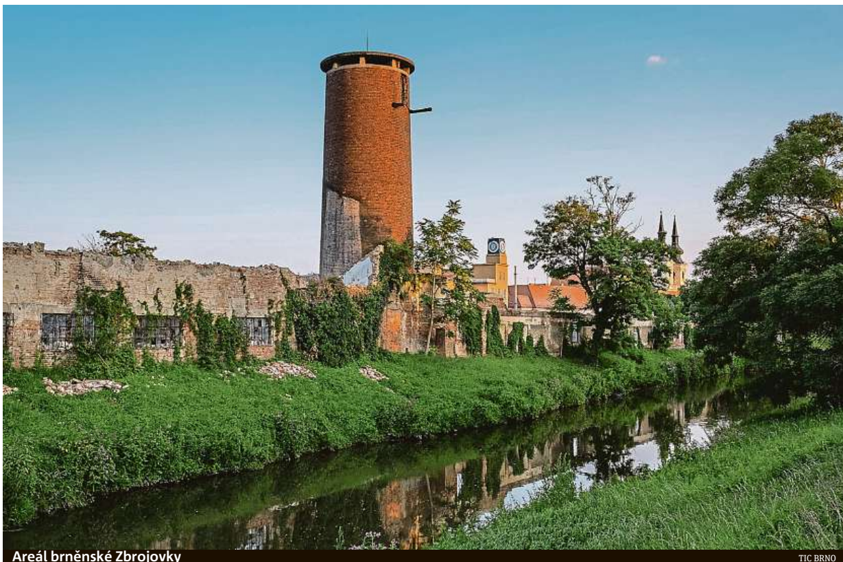
Areál brněnské Zbrojovky