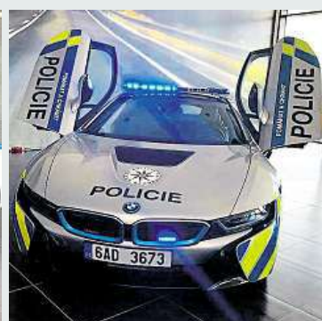
2x TÝDENÍK POLICIE