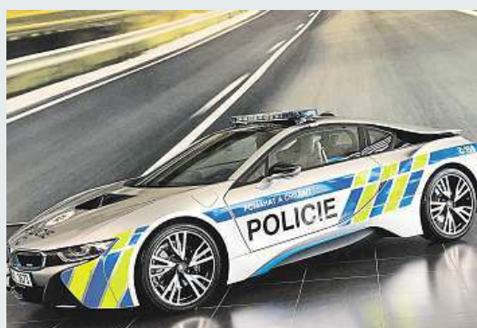
Nový hybridní bourák pro policii – BMW i8. Bude sloužit na dálnici.