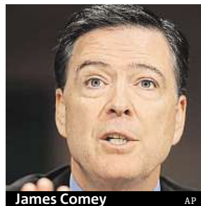
James Comey

Americký Federální úřad pro vyšetřování (FBI) má vysoký kredit, ale nemá ředitele.