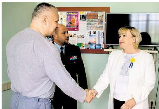
Prezidentova žena s doživotním vězněm

V souvislosti s tím se opět začalo mluvit o tom, že by Kajínek mohl od Zemana dostat milost. Ten opakovaně tvrdí, že není o jeho vině zcela přesvědčen. ČTK