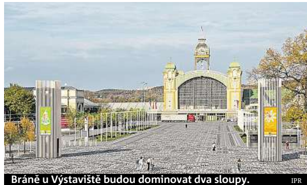
Bráně u Výstaviště budou dominovat dva sloupy.

Zcela opačného názoru je opozice. Podle předsedy zastupitelského klubu TOP 09 a bývalého radního pro výstavnictví Václava Novotného je situace na Výstavišti naprosto tristní a současná pražská koa-