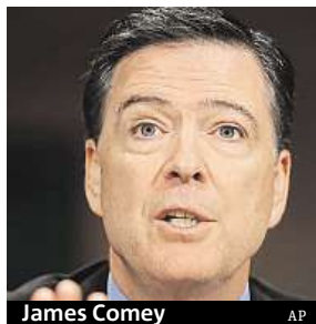
James Comey

„FBI je jednou z nejrespektovanějších institucí naší země,“ uvedl Trump v prohlá-