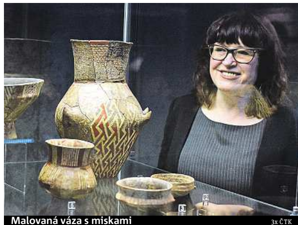
Malovaná váza s miskami