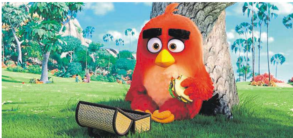
Slavná mobilní hra se dočkala filmové podoby. Pod názvem Angry Birds ve filmu vstoupí zítra do českých kin.

Pestrý program. Očekávaná je cyklojízda, ale těšit se můžete také na gastronomické speciality, hry nebo divadelní představení. Rodiny. Nezapomnělo se ani na akce pro děti, které čeká putování s Pierotem STRANA 2