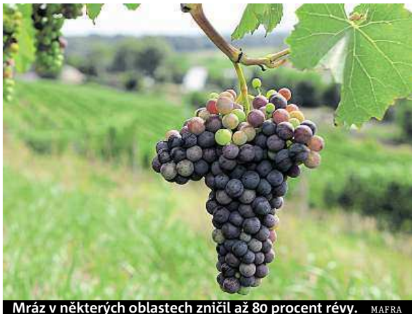
Mráz v některých oblastech zničil až 80 procent révy.

Mrazy v některých oblastech zničily až 80 procent révy.