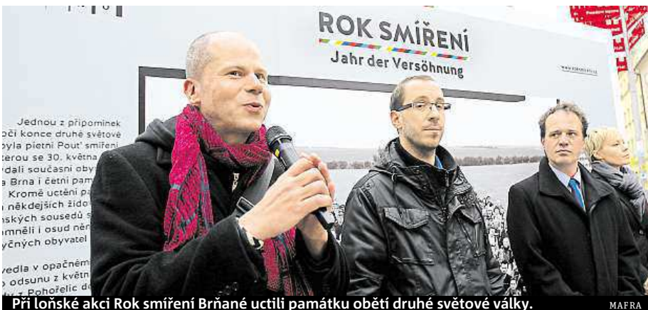
Při loňské akci Rok smíření Brňané uctili památku obětí druhé světové války.

„Chceme z festivalu udělat pravidelnou akci, která bude každoročně na konci května připomínat brněnskou, potažmo českou historickou zkušenost a spolu s našimi středoevropskými sousedy a hosty proměňovat společnou minulost v přátelskou diskusi o věcech