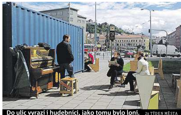
Do ulic vyrazí i hudebníci, jako tomu bylo loni. 2x TÝDEN MĚSTA

i zapojit. Lužánky během Týdne města hostí také soutěž o nejlepšího brněnského amatérského cukráře. Vítání jsou všichni milovníci sladkého. Porotcem se totiž stane každý, kdo přijde. Pod otevřené nebe se přestěhuje i pravidelný blešák Hadrárna. Nově kousky do svého šatníku si