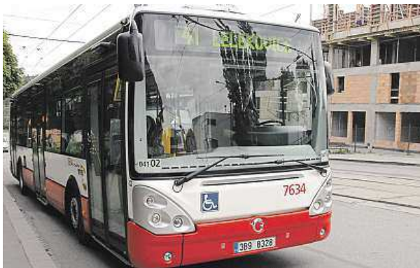
Průměrně si řidiči těchto vozidel vydělají 28 700 korun. MAPRA

Podle Lukšové je to dáno tím, že se ženy bojí technických věcí. „Trolejbus je nejen velký, ale také musí řidiči umět nahodit dráty. Ani v minulosti trolejbusy moc žen neřídilo,“ doplnila. I řízení autobusu platívalo vždy za mužskou práci. „Než mohl někdo sednout za volant, musel mít dva roky praxe s nákladním autem,“ dodala Lukšová.