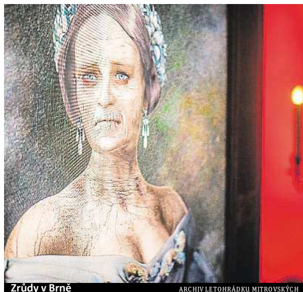
Zrůdy v Brně