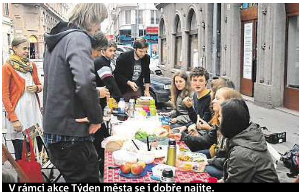
V rámci akce Týden města se i dobře najíte.

Jednou z největších událostí bude jistě oblíbená cyklojízda městem, která startuje 18. května v šest večer od kina Scala. Hudebníci si dají sraz mimo jiné před Janáčkovým divadlem, kde se sejdou zpěváci, kytaristé či beatboxeři.