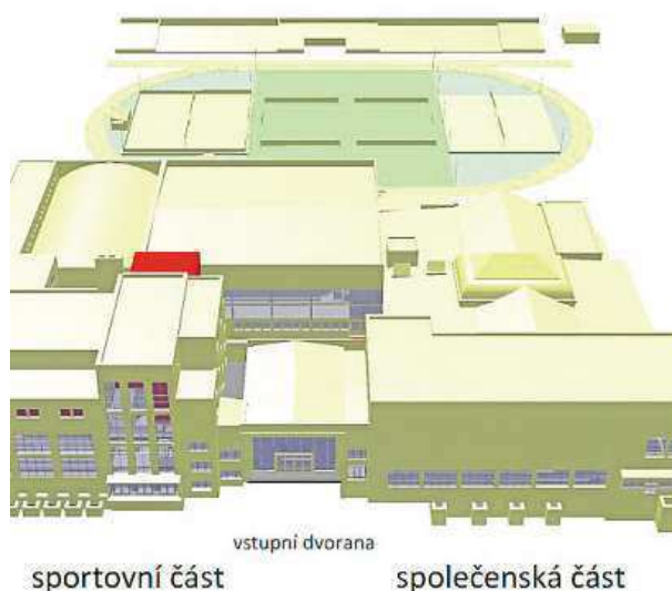
Vizualizace centra Sokola v Kounicově ulici