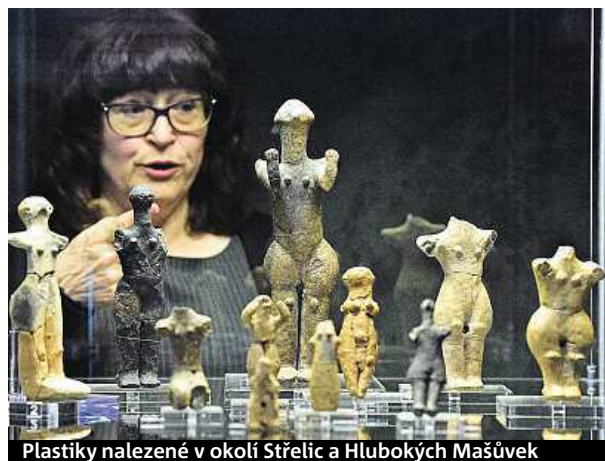
Plastiky nalezené v okolí Střelic a Hlubokých Mašůvek