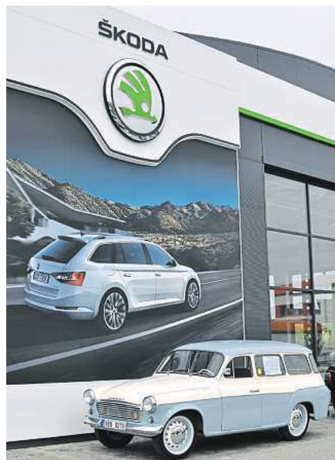
Tak jde čas...