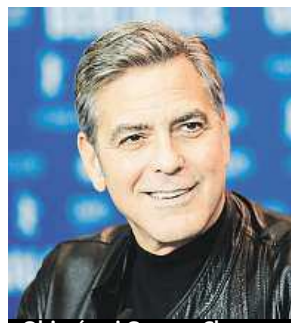
Objeví se i George Clooney a Charlize Theronová.

vštěva americké hlavy státu v Hirošimě od chvíle, kdy americká atomová puma na konci druhé světové války srovnala toto japonské město se zemí. Památník v Hirošimě navštíví podle včerejšího prohlášení Bílého domu v doprovodu japonského premiéra Šinzó Abeho. Obama uctí památku obětí bombardování. ČTK