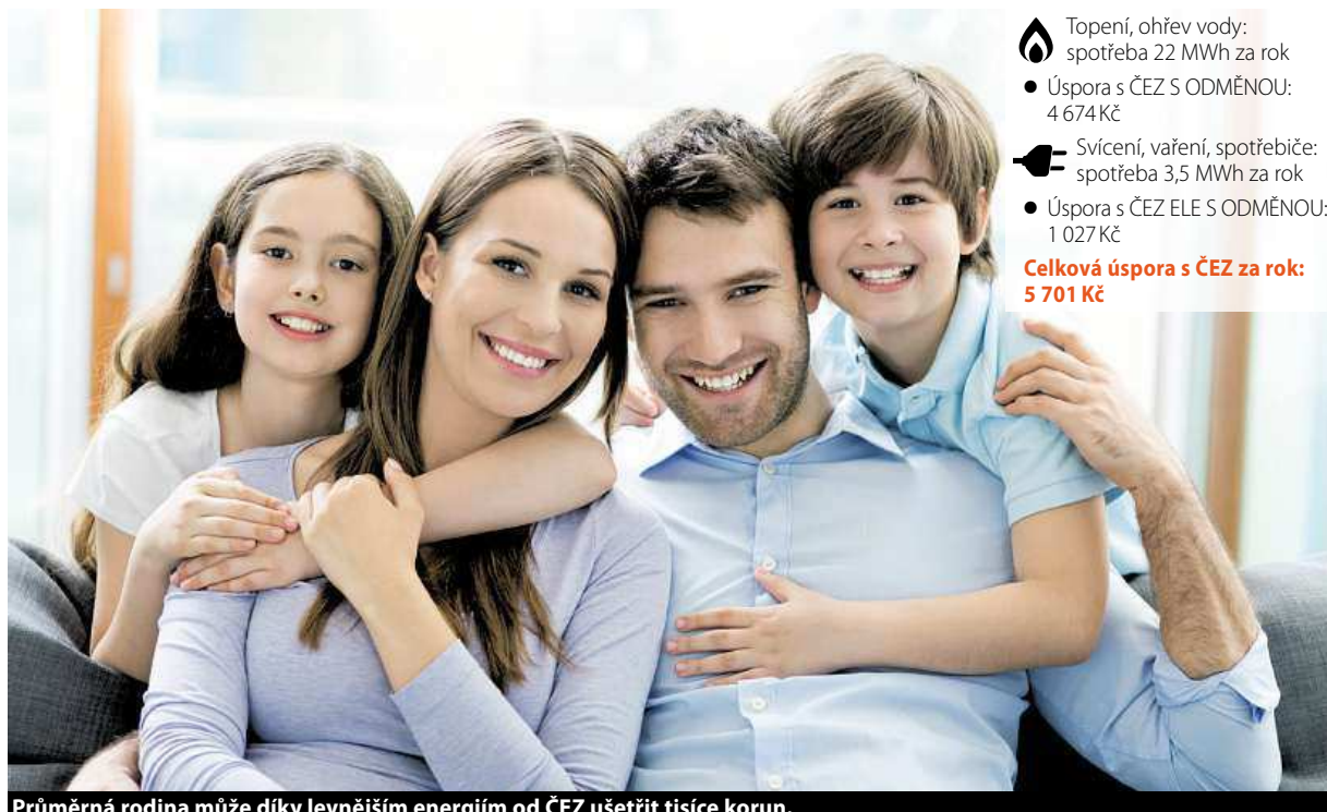
Průměrná rodina může díky levnějším energiím od ČEZ ušetřit tisíce korun.

Elektřina i plyn zaznamenaly další pokles velkoobchodních cen na burze, na snížení cen komodit proto reaguje i řada dodavatelů, kteří zlevňují faktury konečným spotřebitelům.