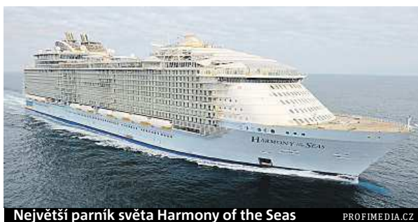
Největší parník světa Harmony of the Seas

Královnou výletních lodí je Harmony of the Seas . Zítra poprvé vypluje největší parník současnosti pod vlajkou rejdařské společnosti Royal Caribbean International, která si jeho stavbu objednala. Postavila jej