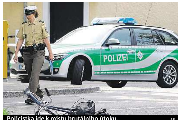
Policistka jde k místu brutálního útoku.

Policisté násilníka zadrželi krátce po činu a ihned ho vyslechli. Ten se ke všemu přiznal. Neměl zřejmě žádné komplice. Podle bavorského ministra vnitra Joachima