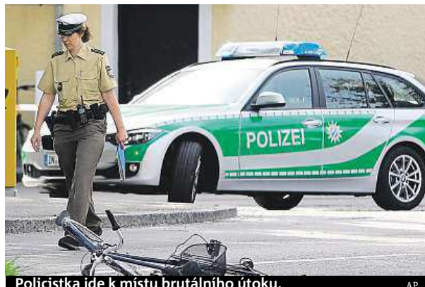
Policistka jde k místu brutálního útoku.

Policisté násilníka zadrželi krátce po činu a ihned ho vyslechli. Ten se ke všemu přiznal. Neměl zřejmě žádné komplice. Podle bavorského ministra vnitra Joachima