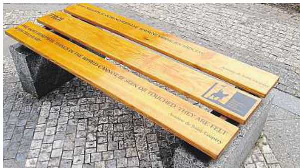
První obnovená lavička u hotelu Jalta

Na Václavském náměstí se objeví nové lavičky.