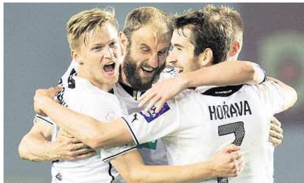
Na Letné se z gólů radovali pouze hosté z Plzně.

Fotbalisté Plzně zvítězili ve šlágru 27. kola první ligy na půdě Sparty 2:0.