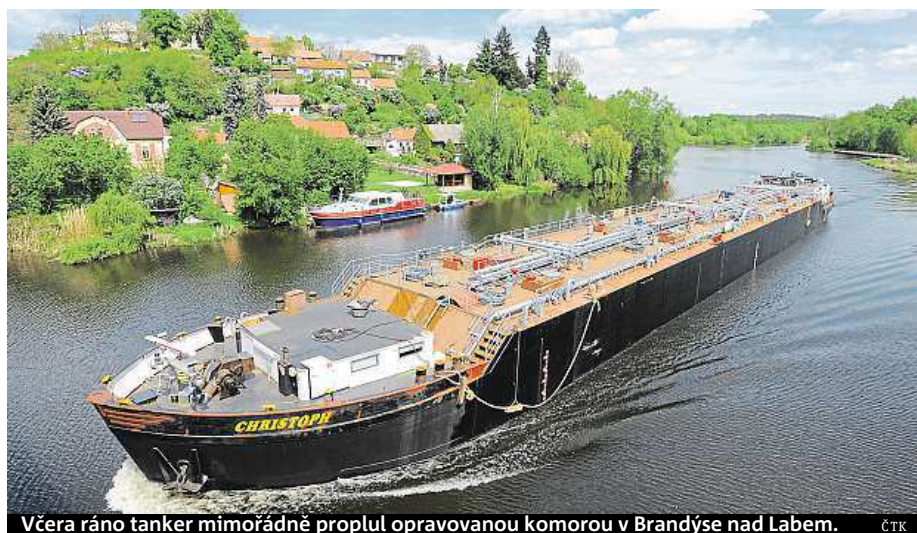
Včera ráno tanker mimořádně proplul opravovanou komorou v Brandýse nad Labem. ČTK

týdny potom tlačný remorkér po řece dopravil z Lovosic nový střední segment. Dělníci ve Chvaleticích starou středovou sekci odřízli a sešrotovali. Na nový nákladový prostor přivařili původní části lodi, kde jsou strojovna a kabina. Tím loď zkompletovali. Důvodem výměny středové sekce byl kromě jejího opotřebení i požadavek Evropské unie, aby tankery na chemické látky měly dvouplášťové dno. ČTK