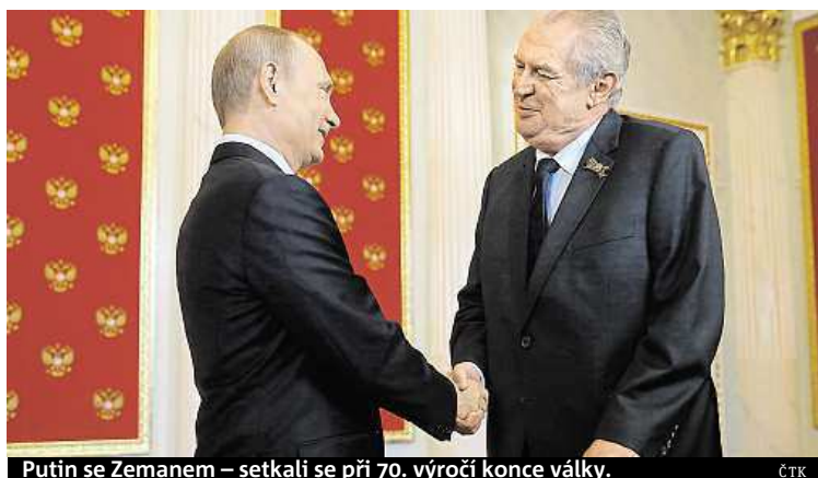
Putin se Zemanem – setkali se při 70. výročí konce války.

Do konce letošního roku budou zrušeny sankce, Rusko se stane členem EU. Český prezident předpověděl budoucnost Ruska.