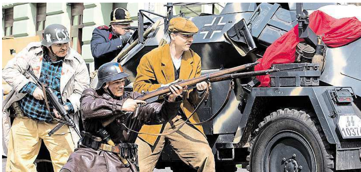
Na Havlíčkově náměstí proběhla Barikáda 2015 – komentované bojové ukázky událostí Pražského povstání. Více strana 5 MAPRA

Smyslné půjčky. Hypotéka na bydlení nebo leasing na auto. Život na dluh. Že je to běžné, si myslí skoro dvě třetiny lidí. Celková zadluženost. U českých domácností přes jeden a čtvrt bilionu korun STRANA 6