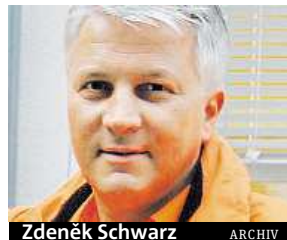
Zdeněk Schwarz

Odboráři chtějí výměnu ředitele záchranky Schwarze. Praha je proti.