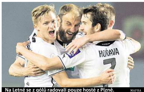
Na Letné se z gólů radovali pouze hosté z Plzně.

Fotbalisté Plzně zvítězili ve slágru 27. kola první ligy na půdě Sparty 2:0.